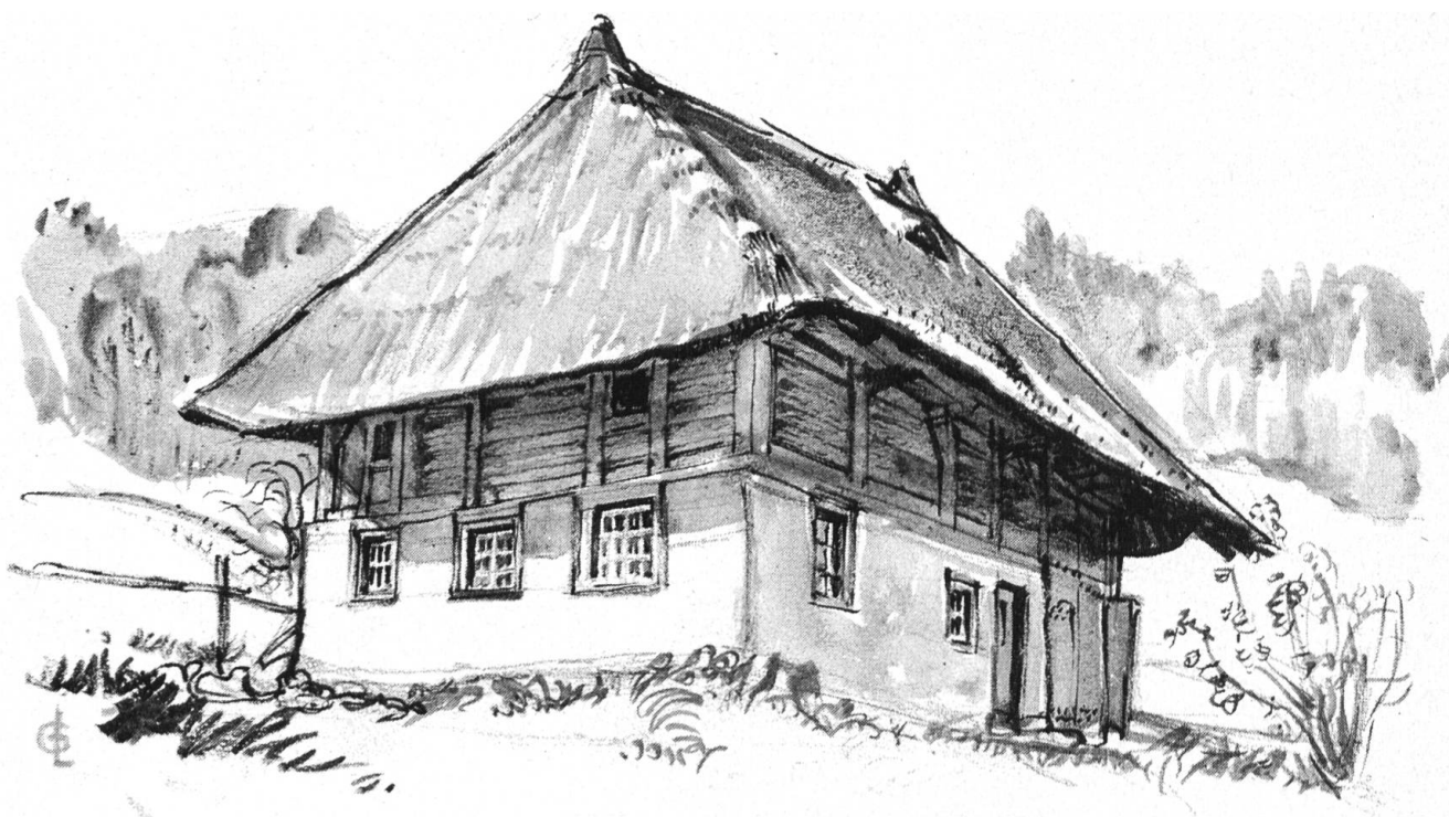
Rohr an der Schafmatt: Der HS bemühte sich besonders um die Erhaltung und Wiederherstellung dieses letzten Strohdachhauses im Kanton Solothurn.

Schweizer die vor seiner Haustüre liegenden Naturschönheiten erst entdecken lassen. . .