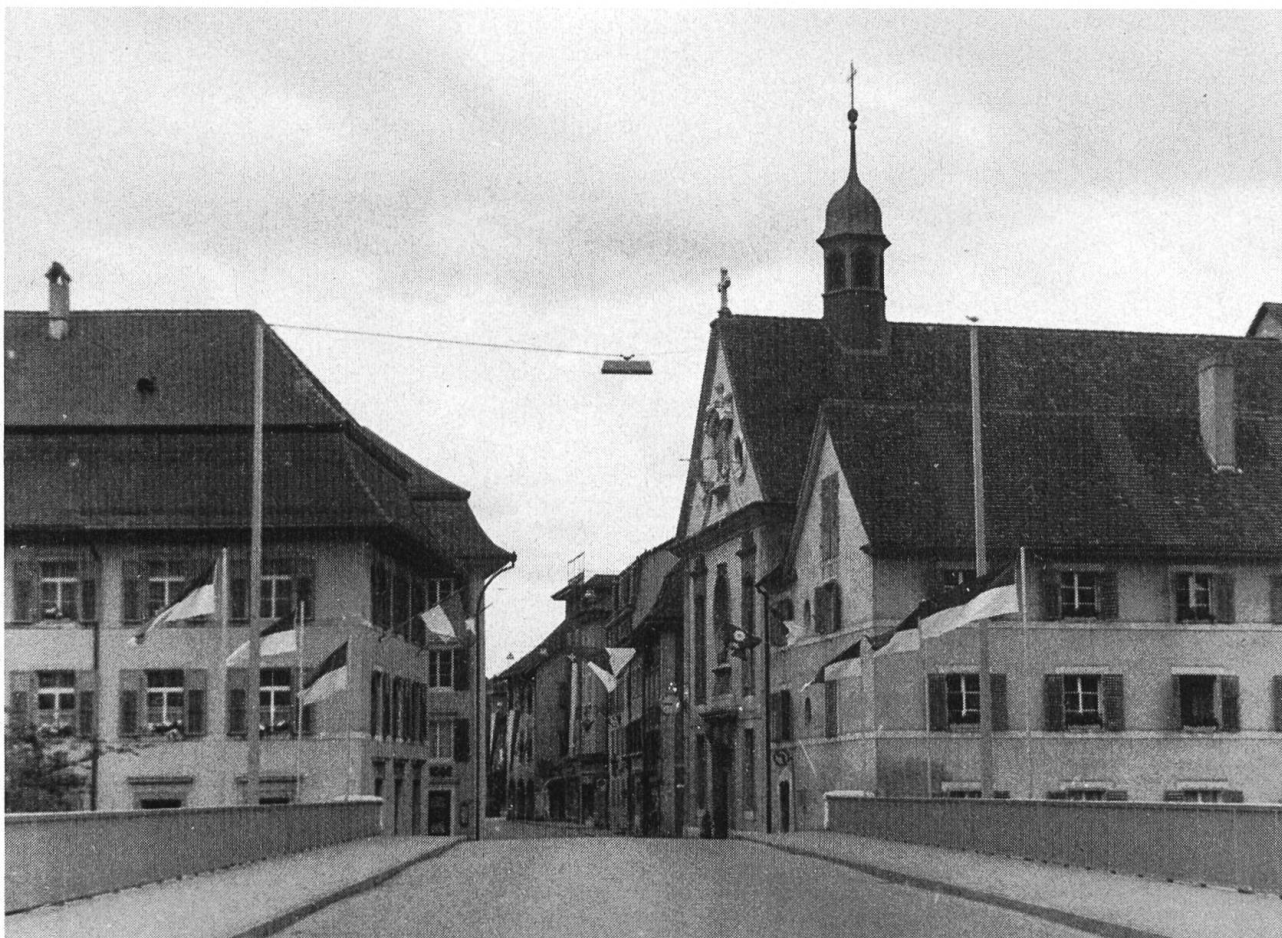
Nur bis auf die Mitte der Brücken geht der festliche Zug. Im Hintergrund die Bruderschaftskirche am Alten Spital und die reich beflaggte Vorstadt.

S isch cheibe schön — und s blibt derby— Uf dere Wält, doch druff muesch sy!