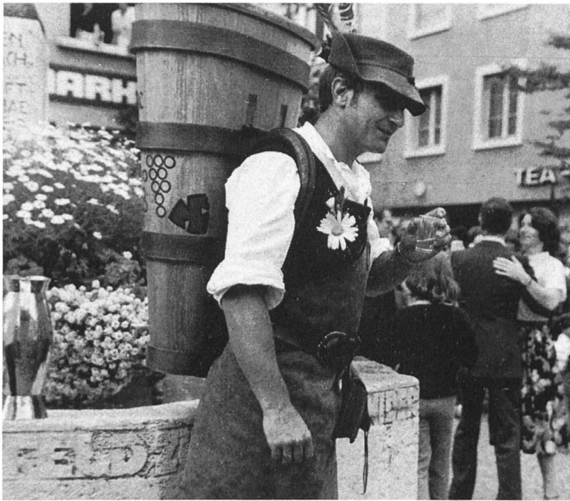
Der Bräntema darf an der Chilbi nicht fehlen: Er trägt im Festzug den kühlen Spittelwein für die Tänzer und Zuschauer mit.