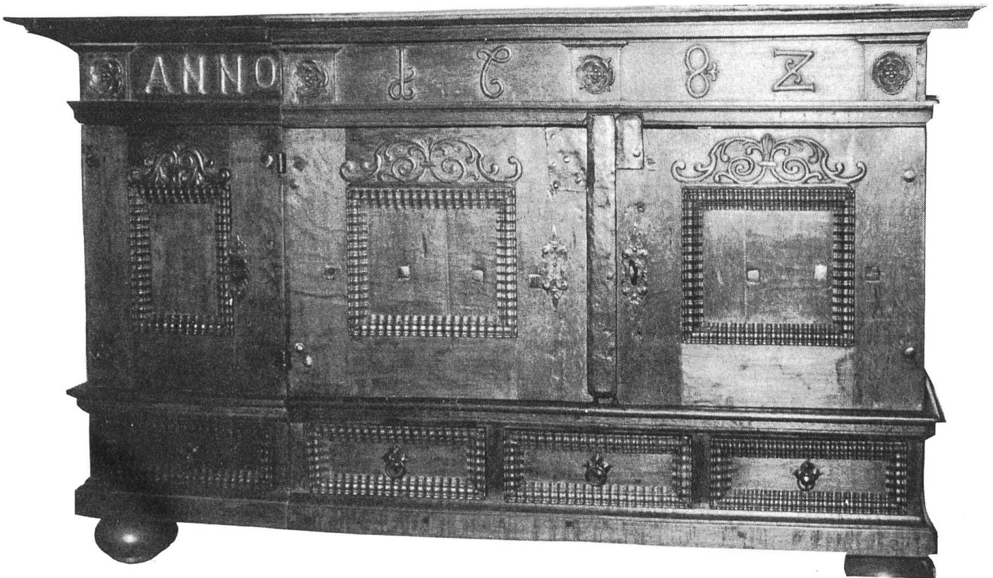
Sakristeischrank aus Eichenholz, 1682

Das Dorfmuseum Therwil geht ausschliesslich auf private Initiative zurück. Es wird von der «Arbeits- und Interessengemeinschaft Alt Therwil» getragen. «Alt Therwil» ist ein Verein mit ca. 350 Mitgliedern. Die Räumlichkeiten des Dorf museums, welches in einem Bauernhaus an der Bahnhofstrasse untergebracht ist, wurden lediglich gemietet, so dass es sich eigentlich vorerst nur um ein Provisorium handelt. Die Einwohnergemeinde und die Bürgergemeinde Therwil leisten an «Alt Therwil» jährliche Beiträge von total Fr. 4500.—. Damit und mit den Beiträgen der Mitglieder von «Alt Therwil» wird die finanzielle Basis für das Dorfmuseum geschaffen. Eine eigene Museumskommission ist für den Betrieb des Museums verantwortlich.