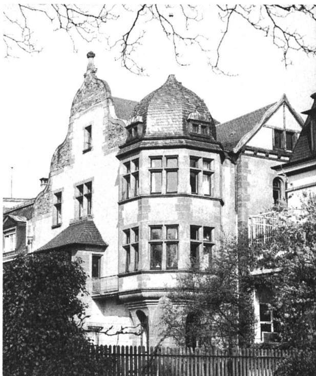
Herrschaftshaus am Schaffhauser Rheinweg 55 in Basel, 1899, von K. Moser.

bald in Betonbauten ertrinken, sind wir über die Basler Pauluskirche doppelt froh! (siehe Architekt Rolf Keller: «Bauen als Umweltzerstörung»).