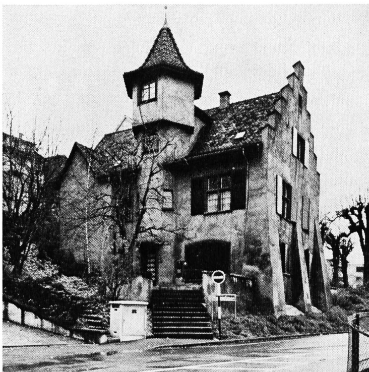
Das Holeschloss vor der Restaurierung.

eines der Gundeldinger-Schlösser. Er lebte auf grossem Fuss, ging aber fromm zur Kirche, ja stellte sich gar einem der Kinder des ersten reformierten, über 73jährigen Pfarrers zu St. Leonhard als Pate. Erst drei Jahre nach seinem Tod, als die Erben 1559 untereinander Streit bekamen, wurde ruchbar, wen die Basler eigentlich aufgenommen hatten: Einen wohl sehr hochstaplerischen Sektenführer, der sich von seinen Anhängern als Prophet verehren liess und die gespendeten Gemeindegelder offenbar für seinen eleganten Lebensstil verwendete — dabei war er von Beruf ein einfacher, aber modisch schillernder Kunstmaler! So wurde David Joris nachträglich noch zum Feuertod verurteilt; seine Leiche wurde ausgegraben und vom Henker vor den Stadtmauern verbrannt — sehr zum Gespött der Andersgläubigen. Mit den Nachkommen waren die Basler Ratsherren indessen nachsichtig und zogen sie keineswegs «bis aufs Hemd» aus.