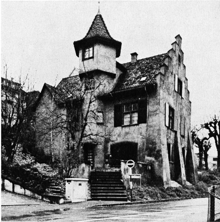
Das Holeeschloss vor der Restaurierung.

eines der Gundeldinger-Schlösser. Er lebte auf grossem Fuss, ging aber fromm zur Kirche, ja stellte sich gar einem der Kinder des ersten reformierten, über 73jährigen Pfarrers zu St. Leonhard als Pate. Erst drei Jahre nach seinem Tod, als die Erben 1559 untereinander Streit bekamen, wurde ruchbar, wen die Basler eigentlich aufgenommen hatten: Einen wohl sehr hochstaplerischen Sektenführer, der sich von seinen Anhängern als Prophet verehren liess und die gespendeten Gemeindegelder offenbar für seinen eleganten Lebensstil verwendete — dabei war er von Beruf ein einfacher, aber modisch schillernder Kunstmaler! So wurde David Joris nachträglich noch zum Feuertod verurteilt; seine Leiche wurde ausgegraben und vom Henker vor den Stadtmauern verbrannt — sehr zum Gespött der Andersgläubigen. Mit den Nachkommen waren die Basler Ratsherren indessen nachsichtig und zogen sie keineswegs «bis aufs Hemd» aus.