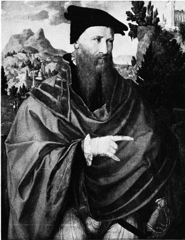
Bildnis des Wiedertäufers David Joris. Gefirnisste Tempera auf Eichenholz, von Jan van Scorel. 89 x 68,5 cm. Kunstmuseum Basel.