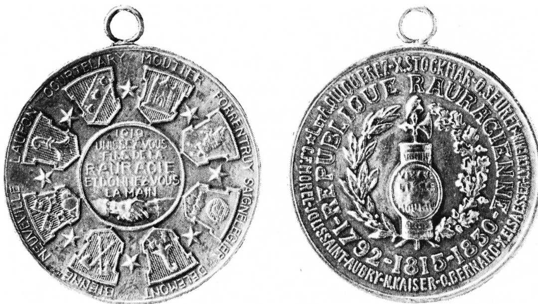
Raurachertaler (Original 3 cm Durchmesser):

Das von Eichenlaub und Lorbeer umgebene Liktorenbündel mit der Jakobinermütze auf dem Beil verrät eindeutig den französisch-revolutionären Einfluss.