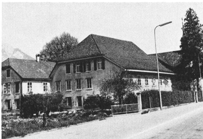
St. Katharinen.

eine andere Bestimmung und wurde ein Heim für hilflose ältere Leute, für unheilbar Kranke und Irre. Das Haus stand unter der Obhut der Stadtverwaltung. Die älteste vorhandene Rechnung datiert aus dem Jahre 1591. Nach dem Bau der kantonalen Heil- und Pflegeanstalt Rosegg im Jahre 1859 wurde das St.-Katharinen-Haus zum eigentlichen Altersheim. Ein Markstein in der Geschichte des St.-Katharinen-Hauses bedeutete das Jahr 1858. In diesem Jahr wurde die Führung der Hausverwaltung und die Betreuung der Insassen durch die barmherzigen Schwestern des Bürgerspitals übernommen. An dieser Tatsache hat sich bis heute nichts geändert, und der gute Ruf, dessen sich unser Altersheim erfreut, ist nicht zuletzt auf das segensreiche und selbstlose Wirken dieser verehrten Spitalschwestern zurückzuführen.