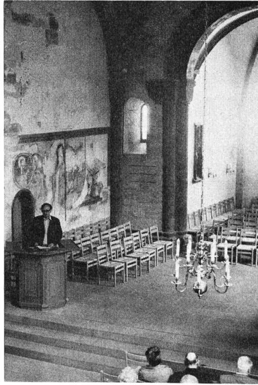
St.-Arbogast-Kirche MuttENZ: Blick in den Ostteil: Kirchenschiff mit Kanzel, Chor, Wandpfeiler mit vorspringenden Halbsäulen, Kreuzrippe, hinter dem Vortragenden Fresken.

liche Feudalburgen entstanden, die für den Berggrat namensgebend waren. Wie der Tagesreferent, der basellandschaftliche Denkmalpfleger Dr. Heyer , ausführte, ist unter diesem Gesichtspunkt auch die Befestigung der MuttENZer St.-Arbogast-Kirche zu verstehen: Der mit einem Zinnenkranz und zwei Tortürmen bewehrte 7 m hohe Mauerring wurde jedenfalls errichtet, als die Wartenbergburgen ihrer Funktion, ausser Sitzen des Adels auch Zufluchtstätten der Dorfbevölkerung zu sein, nicht mehr genügten. — Die Grabungen im Kirchengelände förderten viel Überraschendes zutage: Römische und jüngere Spuren liessen auf eine frühchristliche Kirche schliessen. Über ihren spärlichen Resten erhob sich ein romanischer Bau, dessen Westteil im Erdbeben vom St.-Lukas-Tag 1356 in Trümmer fiel. Sein Ostteil, ein längsrechteckiger Viereckchor, blieb erhalten. Er weist ähnliche Bauelemente auf, wie der romanische Teil des Basler Münsters, ohne dass die gleichen Bauleute durch Steinmetzzeichen bestätigt werden. Seine Decke wird von einem Kreuzrippengewölbe getragen. An einem Medaillon ist das Wappen der Münch-Löwenburg zu erkennen, an anderer Stelle das Allianzwapen der Münch-Eptingen. Diese Dekors erinnern daran, dass die Herrschaft MuttENZ, ursprünglich ein Teil des Elsass', später an die Münch überging, die sie mit ihren übrigen Gütern vereinigten. Einer der letzten des Geschlechts, Hans Thüring, liess den Glockenturm am Nordostteil des Schiffs errichten, bekrönt mit einem Satteldach (einer «Käsbissee»).