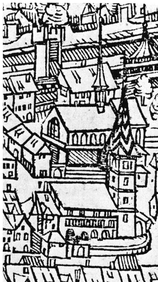
Ausschnitt aus dem Stadtprospekt von Hans Asper, Holzschnitt, 1548

Im August 1476 wurde mit dem Werkmeister Conrad Späti ein Vertrag über den Umbau des zum Teil etwas baufälligen Gebäudes zu einem Rathaus abgeschlossen. Wie damals üblich, ist der Vertrag allerdings sehr summarisch, so dass man sich nur annähernd ein Bild davon machen kann, was Meister Späti tatsächlich baute. Aus weiteren Notizen darf man auf folgende Einteilung schliessen: Im Erdgeschoss wurde die ganze Südfront durch eine offene Arkadenhalle mit fünf Bögen eingenommen; ihre Decke war mit einem farbigen Täfer geschmückt, das sich zum Teil noch erhalten hat. Ausserdem enthielt dieses Geschoss das «Ratsstübli» des Kleinen Rates, das daneben auch als Wirtschaft diente, das «Rechenstübli» des Seckelmeisters, eine Küche sowie einen Korridor mit der Treppe in die oberen Geschosse. Das erste Obergeschoss wurde zur Hauptsache vom grossen Ratssaal eingenommen, zu dem der heutige Steinerne Saal die Vorhalle bildete. Das zweite Obergeschoss diente nach einer Notiz von 1497 anfänglich als Kornhaus. Vielleicht befand sich hier auch noch eine kleine Wohnung für den Hauswirt. Rätselhaft ist, dass der Turm auf der Ostseite, der nach seiner Bauart auch in diese Zeit gehören muss, an keiner einzigen Stelle erwähnt wird. Zum Teil wurde vermutet, dass er schon vor 1476 dastand, doch ist schwer einzusehen, was ein Turm an dieser Stelle für eine Funktion haben konnte. Da die Rechnungen der Baujahre des Rathauses lückenhaft sind, ist