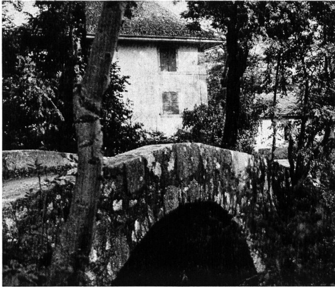
Mühle mit Brüggli in Rickenbach