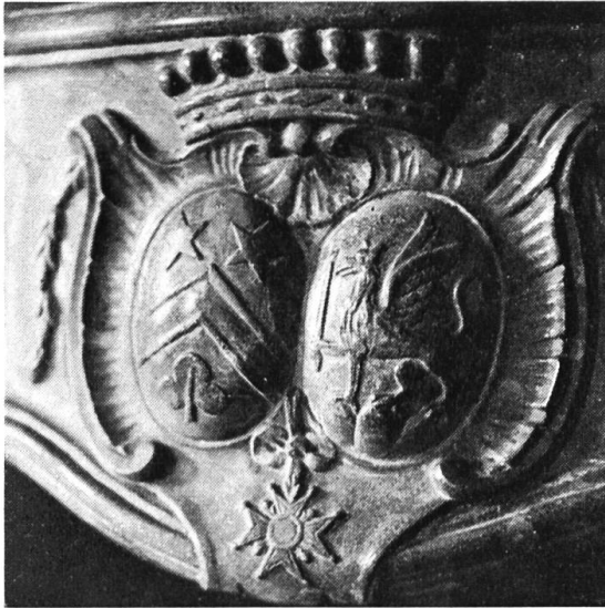
Altermatt-Haus, Wappen des Maréchal de France auf dem Cheminée

die Habseligkeiten von Alt-Meier Stehlin abzuholen, löste einen heftigen Schriftwechsel zwischen dem französischen Obergeneral Scherer und Solothurn aus und führte unter dem Drucke Frankreichs sogar zu vorübergehender Inhaftierung der beteiligten Rodersdorfer. Im September 1795 erlebte das Dorf eine eklatante Grenzverletzung, da drei französische Kompagnien durchmarschierten. Ende 1797 rückten die Franzosen durch die Juratäler bis nach Biel vor, am 1. März 1798 erfolgte der Angriff. General Altermatt vermochte den raschen Fall Solothurns nicht zu verhindern; als Sündenbock beschuldigt zog er sich verärgert auf sein Landgut zurück.