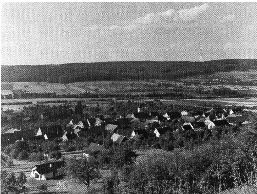
Dorfansicht gegen Liebenschwil