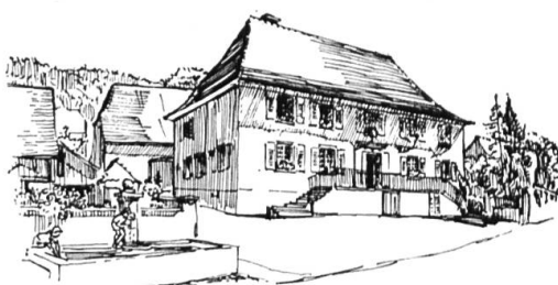
Der Altermatthof in Rodersdorf Zeichnungen von Dr. G. Loertscher («Jurablätter» 1964, S. 132 und 133)