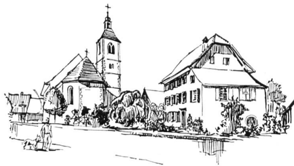
Kirche und Pfarrhaus in Rodersdorf