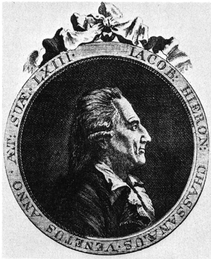
Casanova im Alter von 63 Jahren