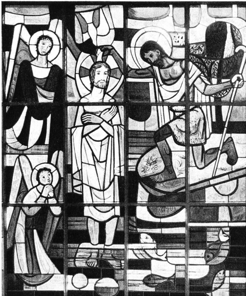
Johannes der Täufer. Glasscheibe von J. Düblin in der Kirche Schönenbuch

und 1792 geschah, berichtet uns kein Eintrag im alten Urbar mehr. Es wird in diesen Jahren auch nichts mehr Neues vorgefallen sein. Was wir aber aus den ehrwürdigen Blättern vernehmen konnten, ist auch so wertvoll genug. — Mit dieser Feststellung beschliesst Dr. Müller seine historische Studie über das heimelige Sundgauer Dörfchen Schönenbuch.