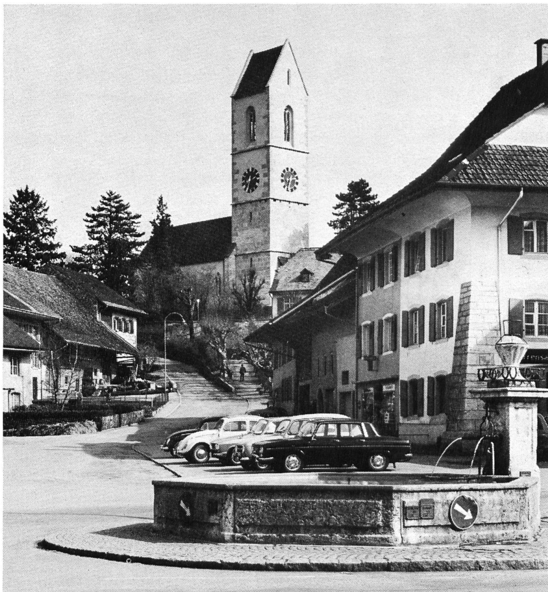
4 Gelterkinden, Dorfplatz mit Kirche

Quergurten gerafft, sondern zudem mit einer prächtigen vierachsigen Giebel- laube und hohem Krüppelwalm ausgezeichnet. Die nur einstöckige alte Wache hat eigenartigerweise, auch gegen Süden, eine kräftig vorspringende «Bernerründe» unter der Dachhaube erhalten.