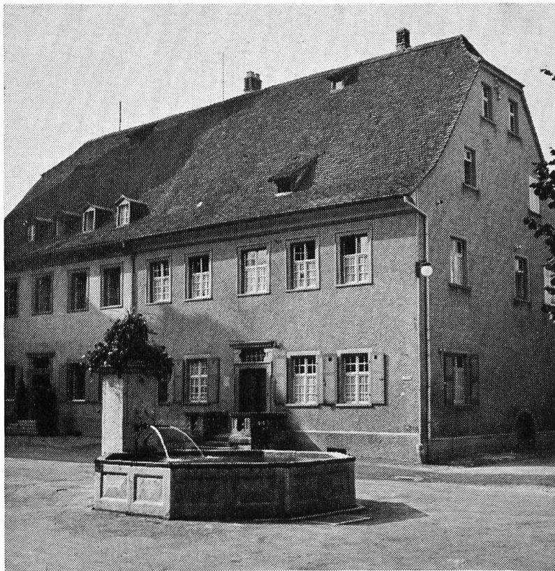
6 Domplatzbrunnen von Arlesheim; an der Ostwand Madonnenrelief von 1766

genden — an diesem grossartigen Domplatz sind reiner Hochbarock: Entwürfe vom Bischöflichen Architekten von Eichstätt, dem Misoxen Jakob Engel (Jacobo Angiolini); erbaut 1681—1687.