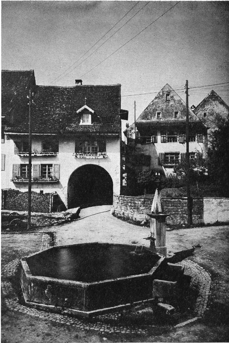
7 Dorfbrunnen von Wenslingen