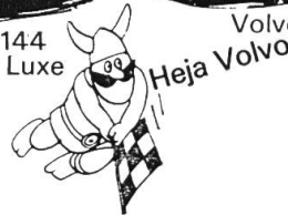
Volvo 1800 ES