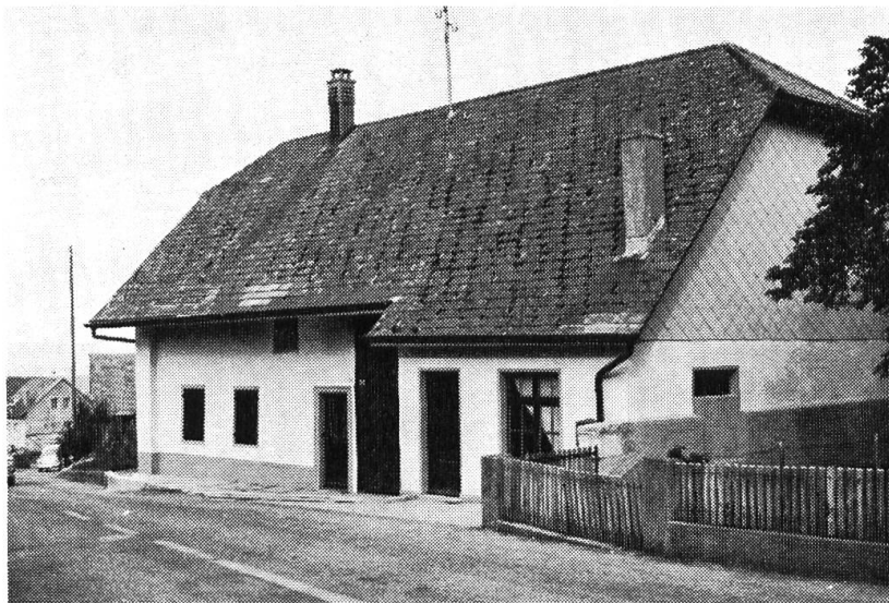
Das zukünftige Heimatmuseum Dulliken

geben, so dass der Verein und die Bevölkerung schon jetzt die Gewähr haben, wieder eine interessante Ausstellung zu erhalten. Der unermüdliche jahrelange Einsatz der Leute vom Verkehrs- und Verschönerungsverein Bellach hat sich gelohnt, in etwa zwei Jahren dürfte Solothurns Vorort sein Dorfmuseum haben.