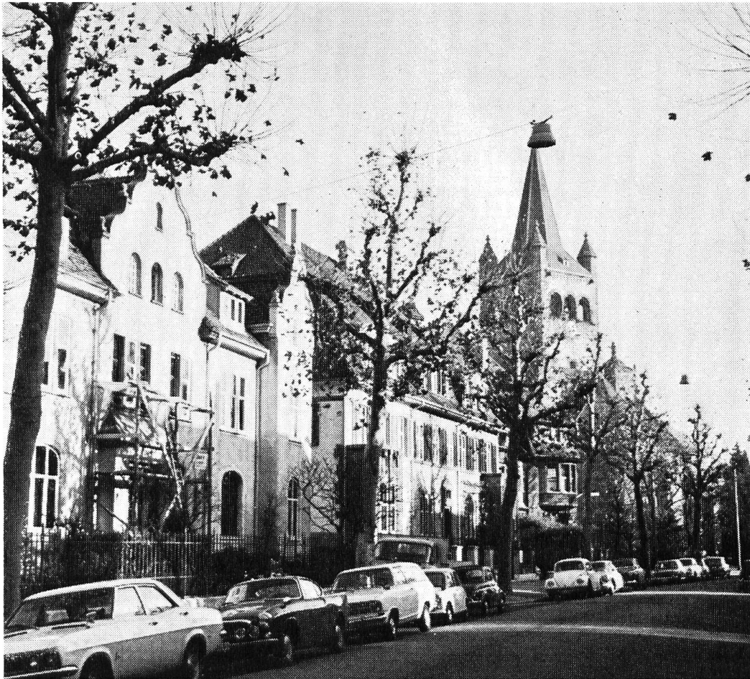
Arnold-Böcklinstrasse. Typisches Jugendstilquartier mit der Pauluskirche von Architekt Karl Moser 1897—1901.