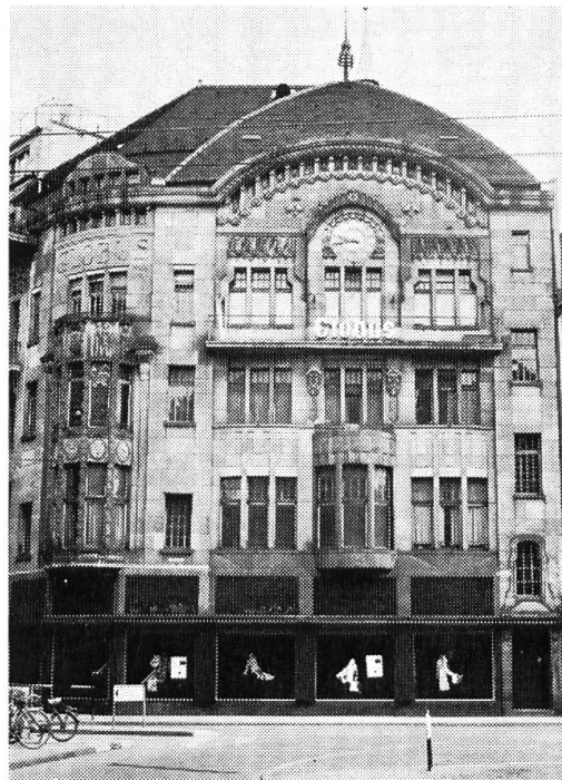
Kaufhaus Marktplatz 1. Architekten Wilhelm Bernoulli und Alfred Romang 1904.

La Roche 1906 erbaut. Die Baumassen der stark bewegten Silhouette sind sehr gut verteilt, die Merkurgruppe des früheren Bahnhofes von Ludwig Maring wurde geschickt eingegliedert. Die neuen Bildhauerarbeiten stammen von August Heer.