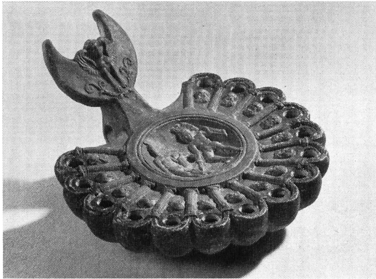
Römische Tonlampe mit 15 Löchern für die Dochten und Lunola (Mondsichel) am Griff.

Rom gefundenen Marmorstücken in schönen Farben und Zeichnungen. Daneben finden sich Produkte vulkanischen Ursprungs, nämlich Lava vom Aetna, vom Vesuv und von Pozzuoli bei Neapel, ferner Gesteine aus dem Yellowstone Park in den USA und eine sehr schöne Kollektion von Bernsteinen. — Im zweiten Raum sind mehr lokalgeschichtliche Gegenstände ausgestellt. — Im dritten Raum sind neben kleinen Sammlungen ägyptischer, etruskischer und römischer Gegenstände eine wertvolle, universelle Dokumentation von Gegenständen einer Pfahlbau-Siedlung vom Neuenburgersee zu sehen. Steinzeitliche Werkzeuge aus Amerika, Frankreich und der Schweiz, römische Funde aus Niedergösgen und Gretzenbach und ein reicher, frühgeschichtlicher Grabfund von Obergösgen runden diesen kulturhistorischen Teil ab.