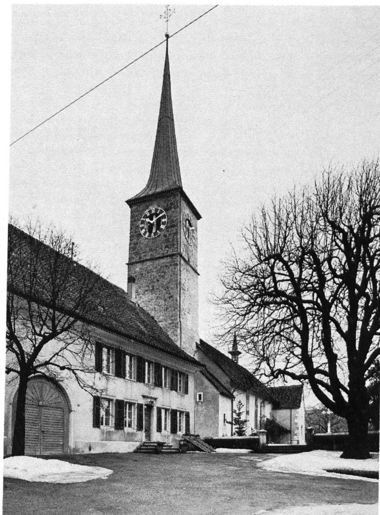
Oensingen. Kirche und Pfarrhaus nach der Restaurierung des Turmes. Am linken Rand die für gesellige Zwecke ausgebaute Pfarr- scheune.

brachten Charakter bewahrt und gleichzeitig in bezug auf die Benutzbarkeit und die entstehenden Kosten annehmbar bleibt.