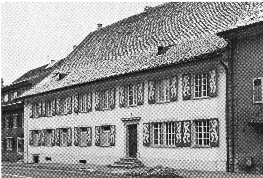
Balsthal. Südfassade des «Löwen» nach den Erneuerungsarbeiten.

Sigristenhaus, Herberge (früher Wachthaus), Schloss-Oekonomie, überragt von der Ruine Neu-Falkenstein auf den schroffen Felsen. Darf man in dieses Blickfeld ein modernes zylindrisches Futtersilo stellen? Und wer zahlt, wenn es schon nicht verhindert werden kann, die Mehrkosten, um es farbig etwas einzustimmen? Wir sind mit der Ansicht, hier dürfe einmal der Respekt vor den eindrucksvollen Geschichtsdokumenten den Vortritt haben, nicht durchgedrungen.