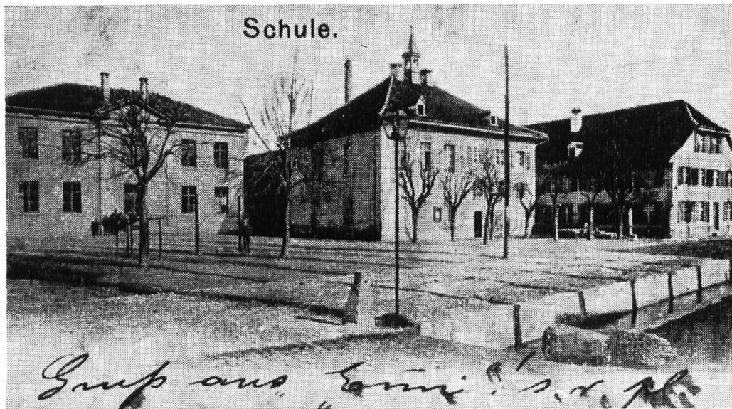
Teilansicht des Unterdorfes um 1900 (Karte von Ernst Feigenwinter, Riehen). Vordergrund: Über den Dorfbach in die Hauptstrasse einmündende Kirchgasse. Mitte: Das 1696 von einem Bürger (Bieglin) gestiftete Bauernhaus diente praktisch unverändert bis 1848 als Schulhaus. 1849 wurde dieses Gebäude umgebaut. Mit zwei Schulzimmern und Lehrerwohnung versehen beherbergte dieses «Alte Schulhaus» bis 1896 die Schule; heute ist darin die Gemeindekanzlei untergebracht. Links: Das 1895/96 errichtete, heute teilweise seinem Zweck entfremdete (Verwaltung) Dorfschulhaus. Rechts: Brauerei.

Die Linienführung des Kanals im Oberdorf lässt unter Berücksichtigung seines Zweckes Rückschlüsse auf den damaligen Besiedlungsstand in dieser Zone zu. Neben der Sicherung des Dorfes vor Überschwemmungen wollte man vor allem möglichst viele Bauernhäuser an das Wasser anschliessen. Das Einbiegen des Kanals vom alten Lauf sogar nach Süden in die Ettingerstrasse lässt sich darum nur so verstehen, dass an diesem Weg schon vor der Korrektur Bauerngehöfte bestanden und jetzt den gewünschten Anschluss an den Bach erhielten. Es ist weiter anzunehmen, dass nicht nur wegen der drei dort vorhandenen Heimwesen diese grosse Arbeit zur Ausführung gelangte, sondern noch andere, bereits bestehende durch diese Laufverlegung an das Wasser angeschlossen werden konnten. Diese mussten an der Ostseite der Strasse nach Aesch gelegen haben, denn die Westseite litt bis dahin bekanntlich unter den Überschwemmungen. Aus diesem Grunde konnte die Brühlgasse, überhaupt das Areal im Oberdorf, welches im unmittelbaren Bereich des alten Baches lag, erst nach der Erstellung des Kanals besiedelt worden sein. Die 1761 noch lockere Überbauung dieser Zone weist in diese Richtung (Abb. 1). Ebenso bestätigen das die damals schon weit auseinanderliegenden Häuserzeilen im Oberdorf. Zwischen ihnen verliefen der