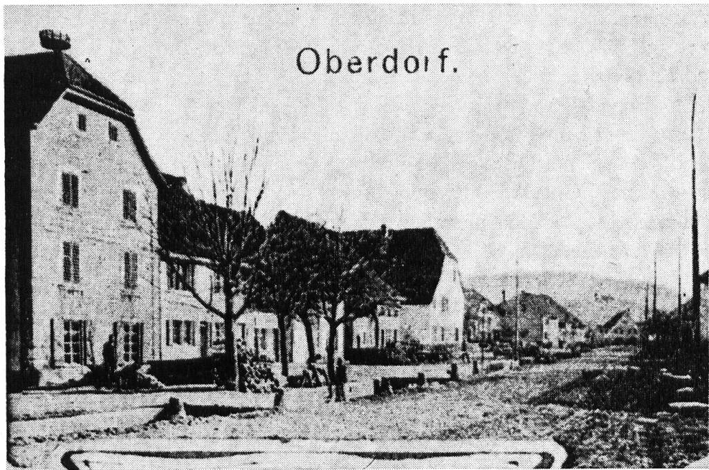
Oberdorf um 1900 (Karte von Ernst Feigenwinter, Riehen). Gasthof «Zum Schlüssel» (mit Storchennest) und Gasthof «Zum Ochsen» (Mittelgrund) mit Krüppelwalmdächern. Der Hauptstrasse entlang, gesäumt durch Wehrsteine, fliesst der offene Dorfbach. Hölzerne Stege überbrücken ihn und bilden die Verbindung zwischen Hofplätzen und Hauptstrasse.