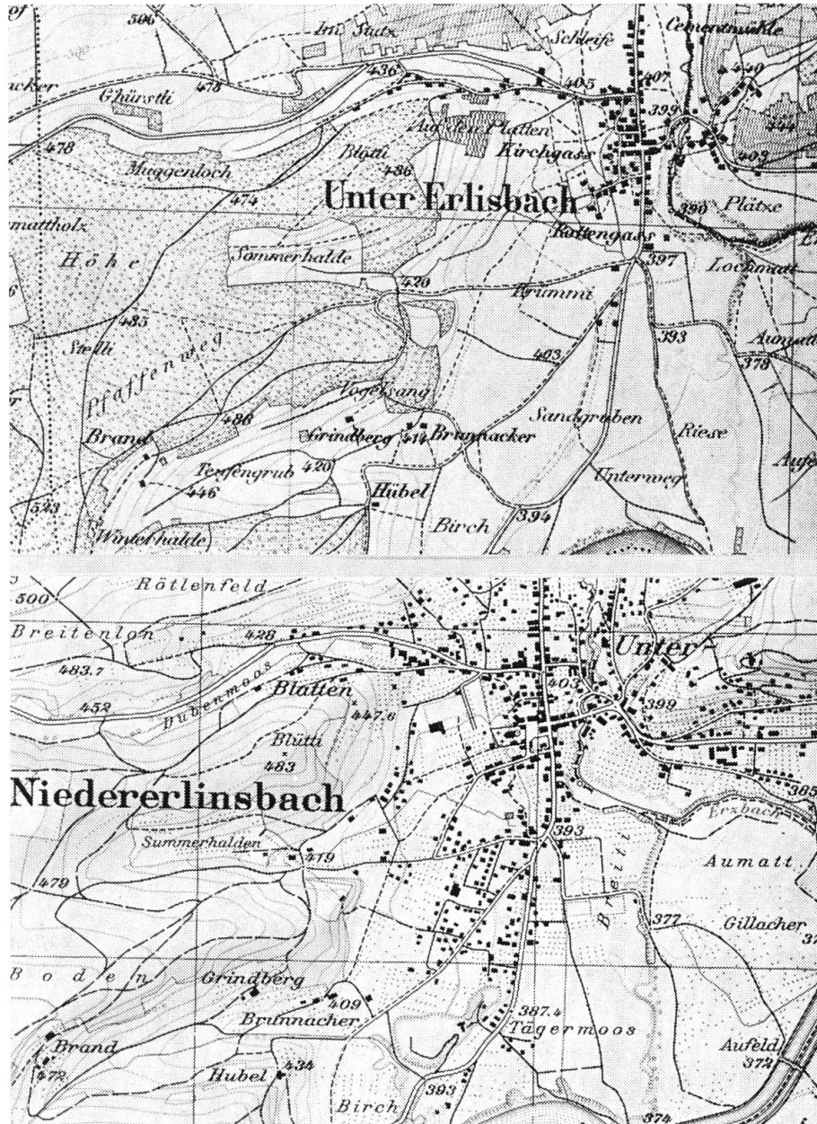
Repro- duziert mit Bewilligung der Eidg. Landes- topographie vom 16.1.1970

Dorf erst 974 Einwohner und 128 bewohnte Häuser. Die Siedlung war eng geschlossen und überliess somit der agrarischen Nutzung ein Maximum an Areal. Deutlicher als heute kam der Strassendorfcharakter zum Ausdruck. An der Abzweigung der Strasse nach Aarau erfolgte eine platzartige Ausweitung, und Kirche, Schmiede, das inzwischen abgerissene Zollhaus und der Gasthof Löwen setzten hier bemerkenswerte Akzente. Die Firste der meisten Bauernhäuser verliefen wie fast überall am Jurasüdfuss parallel zum Hang und besaßen dadurch eine bestmögliche Exposition und die Bauernbetriebe Vorplätze abseits der