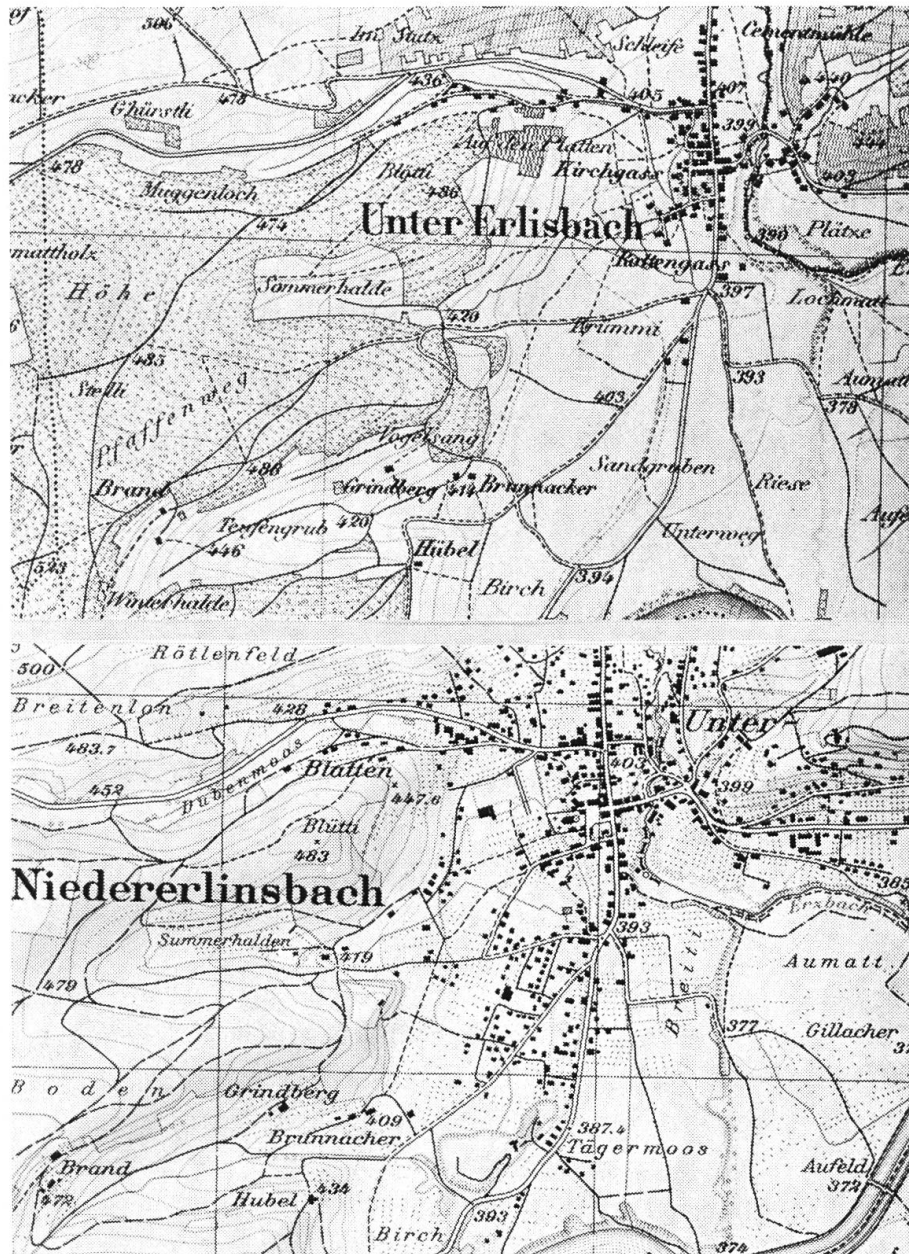
Repro- duziert mit Bewilligung der Eidg. Landes- topographie vom 16.1.1970

Dorf erst 974 Einwohner und 128 bewohnte Häuser. Die Siedlung war eng geschlossen und überliess somit der agrarischen Nutzung ein Maximum an Areal. Deutlicher als heute kam der Strassendorfcharakter zum Ausdruck. An der Abzweigung der Strasse nach Aarau erfolgte eine platzartige Ausweitung, und Kirche, Schmiede, das inzwischen abgerissene Zollhaus und der Gasthof Löwen setzten hier bemerkenswerte Akzente. Die Firste der meisten Bauernhäuser verliefen wie fast überall am Jurasüdfuss parallel zum Hang und besaßen dadurch eine bestmögliche Exposition und die Bauernbetriebe Vorplätze abseits der