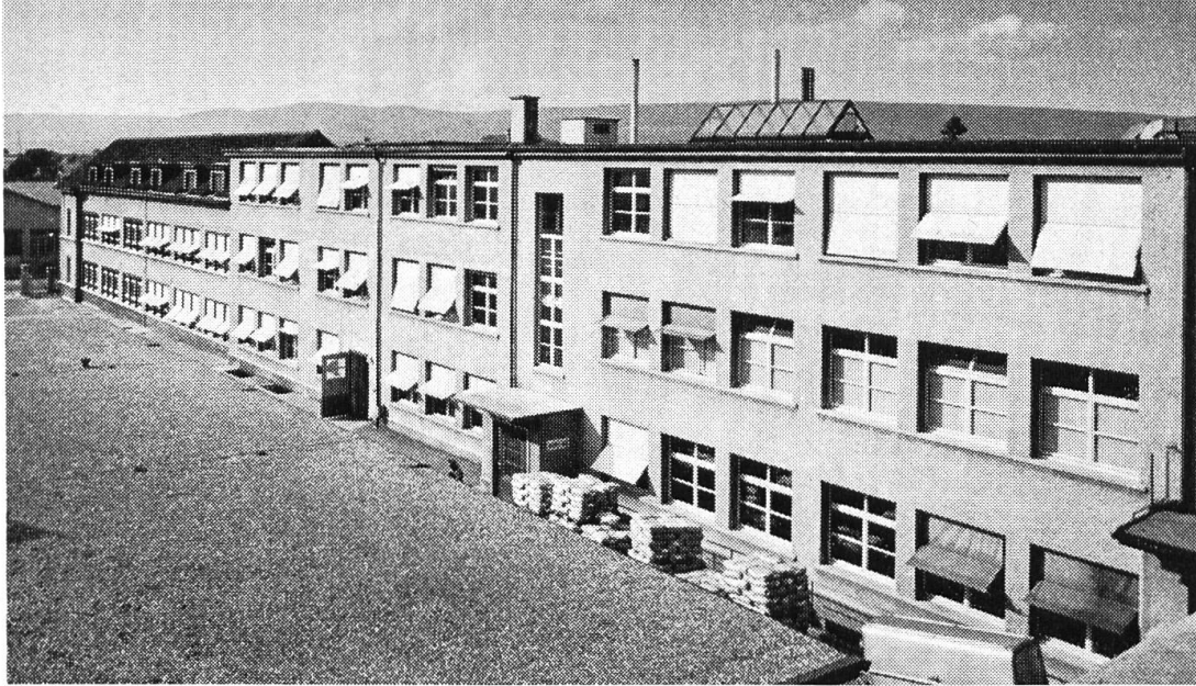
Brac AG, Breitenbach