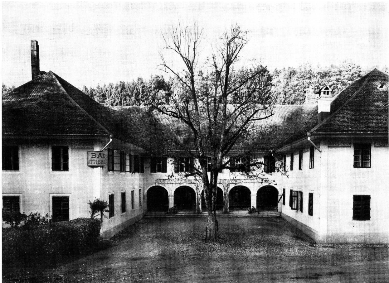
Bad Attisholz um 1925.

gesteigert werden konnte. Eine Verlängerung wollte die Stadt nicht zugestehen, um kein platzgreifendes «Erblechen» befürchten zu müssen. An Pächternamen sind bekannt: die Ruchti, Kratzer, Ruchholz, Flodertschi, Gallitzin, Gasche, Schwyzer, Erismann, Hammer, Moser und die altsolothurnischen Geschlechter Dürholtz, Hirt, Pfluger, Voitel, Frölicher und Brunner. Zur Zeit der Sönderung von Staat und Stadt Solothurn 1803, fiel «Bad Attisholz» der Stadtgemeinde zu. Diese liess es 1840 versteigern. Dann wechselte es während 50 Jahren fünfmal die Hand und wurde 1891 Eigentum der Familie Probst von Bellach.