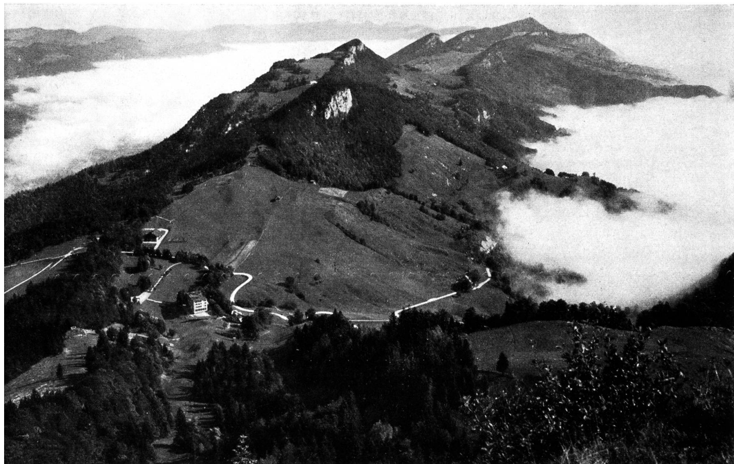
Blick von der Röti.