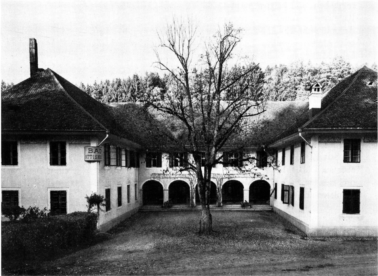
Bad Attisholz um 1925.