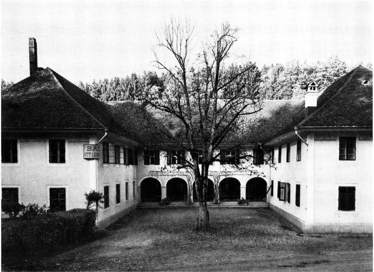
Bad Attisholz um 1925.

gesteigert werden konnte. Eine Verlängerung wollte die Stadt nicht zugestehen, um kein platzgreifendes «Erblechen» befürchten zu müssen. An Pächternamen sind bekannt: die Ruchti, Kratzer, Ruchholz, Flodertschi, Gallitzin, Gasche, Schwyzer, Erismann, Hammer, Moser und die altsolothurnischen Geschlechter Dürholtz, Hirt, Pfluger, Voitel, Frölicher und Brunner. Zur Zeit der Sönderung von Staat und Stadt Solothurn 1803, fiel «Bad Attisholz» der Stadtgemeinde zu. Diese liess es 1840 versteigern. Dann wechselte es während 50 Jahren fünfmal die Hand und wurde 1891 Eigentum der Familie Probst von Bellach.