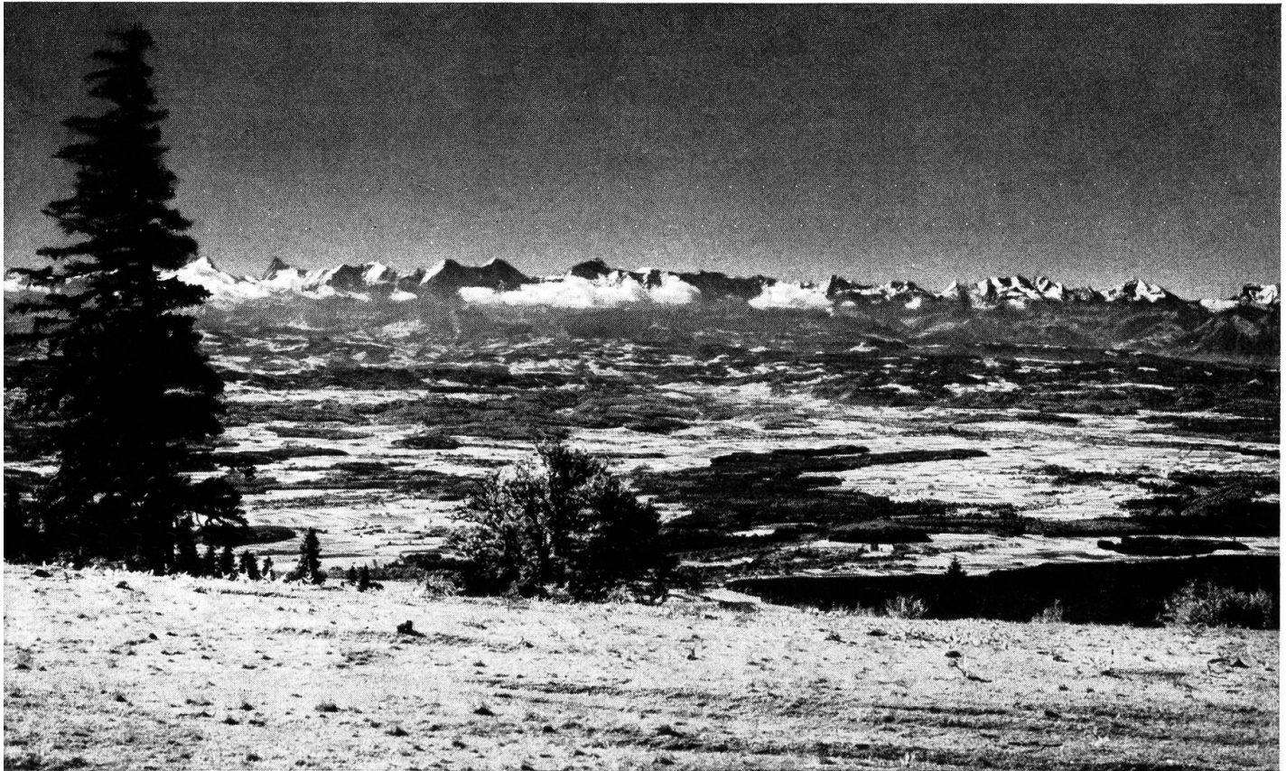
Blick vom Weissenstein.