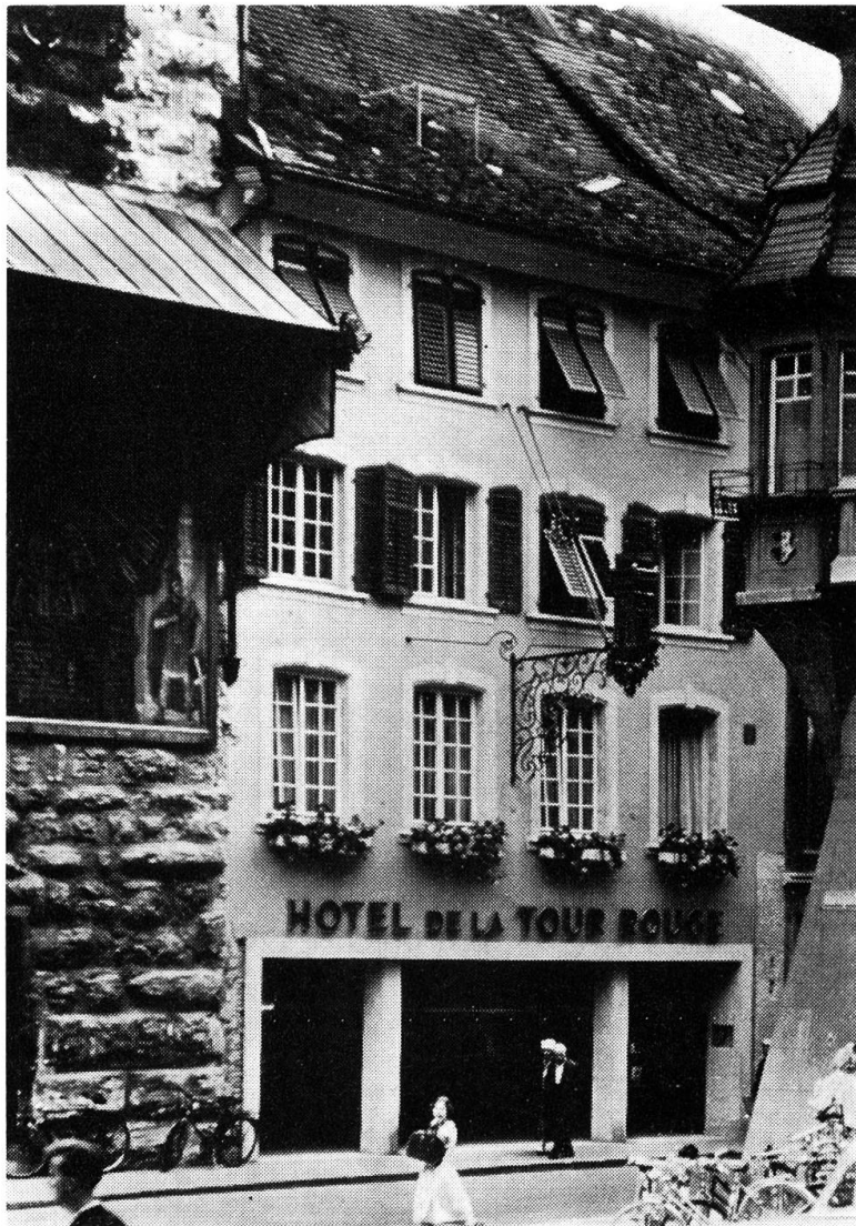
Hotel Roter Turm.