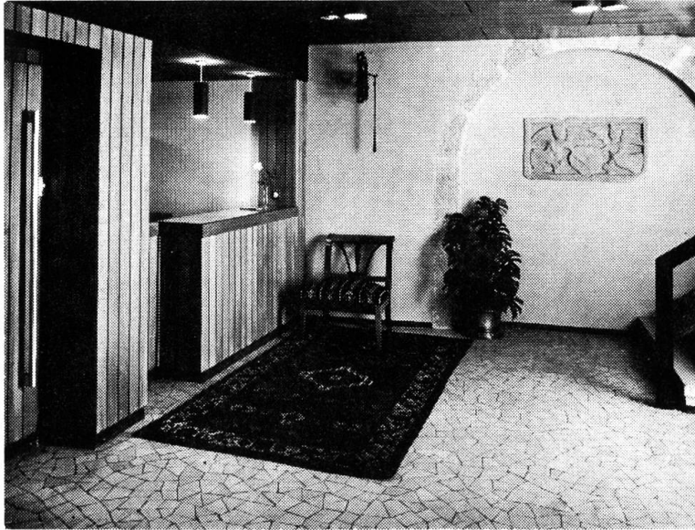
Hotel Roter Turm. Eingangshalle mit Relief der Schützengunft von 1587.

len Hinweisen. So wurden Spuren aus der Bronzezeit festgestellt sowie Mauern einer römischen Hafenanlage für die Flusschiffahrt. Der Zeitglockenturm stammt aus der burgundischen Zeit, als Teil der Stadtburg von den Herzögen von Zähringen errichtet; so könnte das Nebenhaus als ursprüngliche Burgschenke vermutet werden.