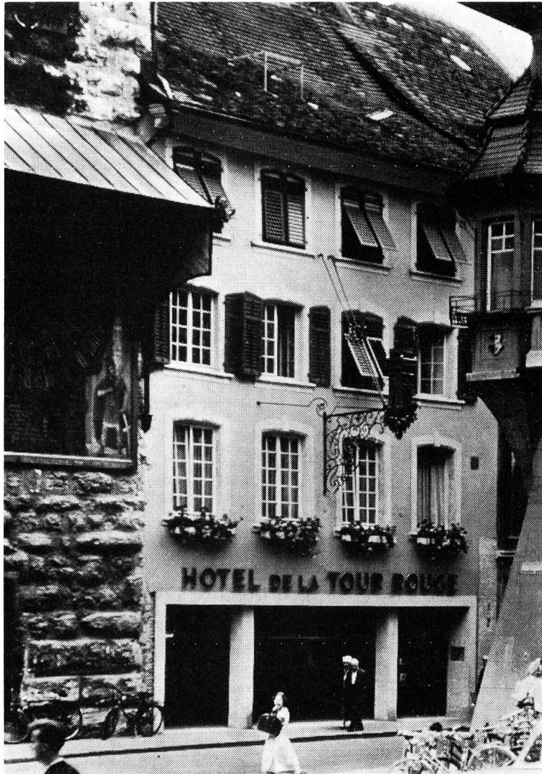
Hotel Roter Turm.