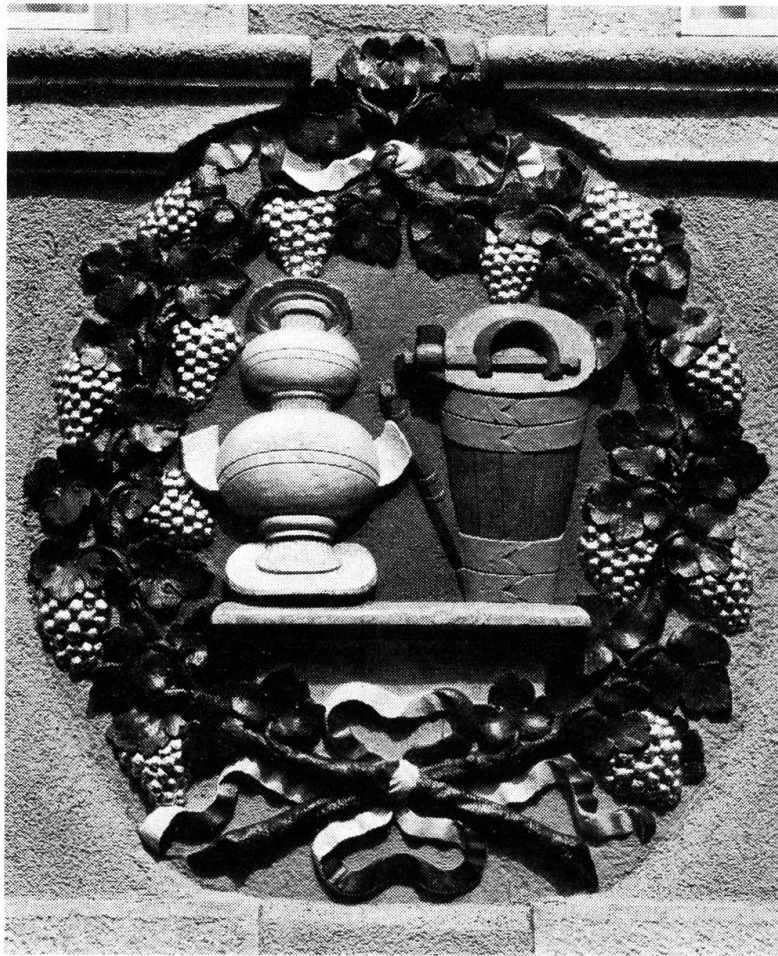
In Stein gehauenes und bemaltes Zunftwappen am Zunfthaus zu Wirthen.

es die Aufgabe der Zunft, den durchziehenden Handwerksburschen auf der Walz Obdach und Zehrung zu gewähren. Aus diesen Begegnungen ergab sich der nötige Wandel: die Innung behielt den Arbeitsmarkt im Griff, überwachte und beeinflusste die Rotation und löste damit das brancheeigene Personalproblem. Besonderes Gewicht schenkte man der Abschirmung gegen aussen, gegenüber Handwerkern aus benachbarten Landsgemeinden und «Stümplern», also den nicht vorschriftsgemäss Gelernten. Eine Handfeste der Küfer von 1688 forderte, dass den «äusseren Meistern . . . in der Stadt und Bürgerzahl . . . alle Arbeit gänzlich untersagt und verboten sein solle . . . allein zugelassen solle sein, die neuen Fässli, Kübel, Zuber, Bütti und andere dergleichen Küferarbeit zu machen und am gewöhnlichen allhiesigen Wochenmarkt, wie bisher feilzuhalten und zu verkaufen».