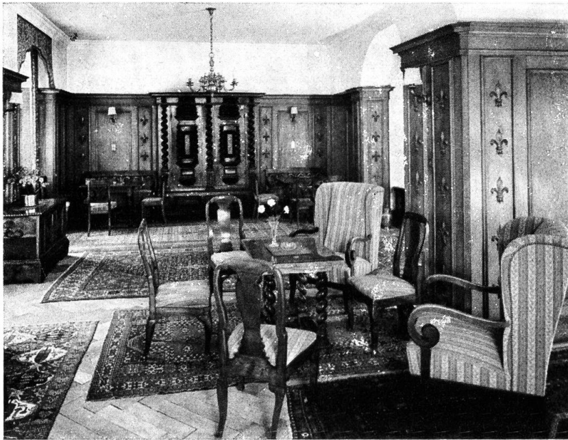
Hotel Krone. Hotelhalle im 1. Stock.

Pisoni und sein Neffe Paolo Antonio Pisoni die barock-klassizistische St. Ursenkathedrale, das dominierende Bauwerk dieser sehenswerten, als geschlossene Einheit wirkenden Aare-Stadt. Pisonis Baustil schlug sich aber noch in weiteren Werken nieder, nicht zuletzt in bestechend schönen Gasthäusern. So wird der Gasthof zum Kreuz in Kriegstetten 1774 Paolo Antonio Pisoni zugeschrieben, ebenso das überaus zierliche Barock-Stöckli des Restaurant Weyeneth in Nennigkofen und natürlich Solothurns stattliche «Krone».