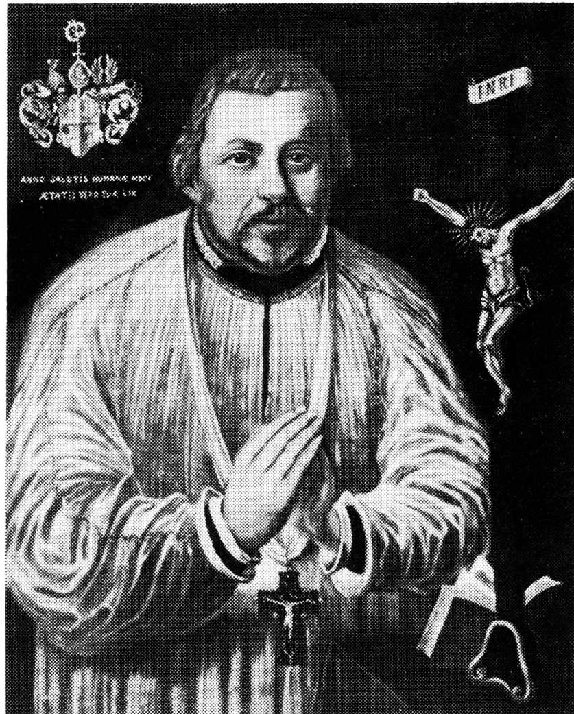
Jakob Christoph Blarer von Wartensee, Fürstbischof von Basel 1575—1608

deckung bei den katholischen Orten. Durch Fühlungnahme mit dem Luzerner Schultheissen Ludwig Pfyffer im Jahre 1578, durch Verhandlungen des bischöflichen Kanzlers Dr. Johann Rebstock mit den VII katholischen Orten gegen Ende dieses Jahres und durch die Intervention des Nuntius für Süddeutschland, Felizian Ninguarda , im Juni 1579, kam Blarer schliesslich zum Ziel: am 19. November 1579 wurde der Bündnisvertrag von den VI katholischen Orten Luzern, Schwyz, Unterwalden, Zug, Freiburg und Solothurn in Luzern besiegelt; im Mai 1580 trat auch Uri dem Bündnis bei. Die feierliche Beschwörung desselben fand am 13. Januar 1580 in Pruntrut statt und war mit grossen Festlichkeiten verbunden.