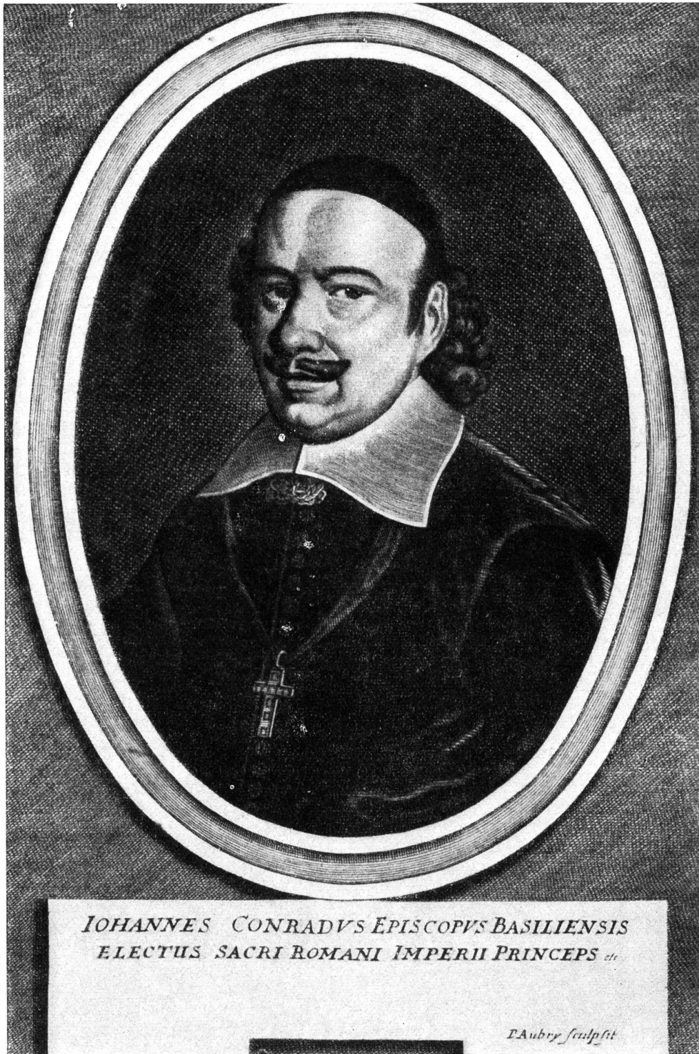
Johann Konrad von Roggenbach, Fürstbischof von Basel 1656—1693