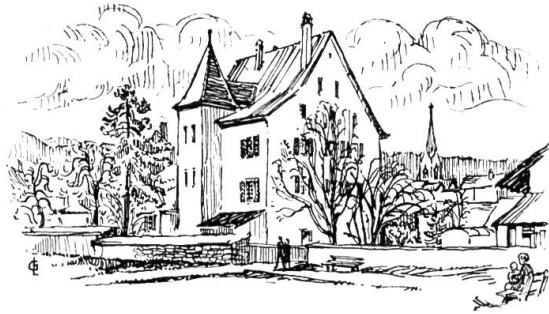
Das Amthaus ehemaliger Hof des bischöflichen Verwalters.

Nun dürfen wir der Stadtgründung von 1295 keine allzugrosse Bedeutung beimessen. Politisch wurde damals weniger Neues geschaffen als Bestehendes sanktioniert. Der Rat wurde in freier Wahl von den Bürgern bestimmt, doch der Stadtmeier konnte nur vom Bischof selbst auf Lebenszeit ernannt werden. Praktisch besorgte die wichtigsten Amtsgeschäfte der Landvogt des Bischofs, mit Wohnsitz im Schloss Zwingen.