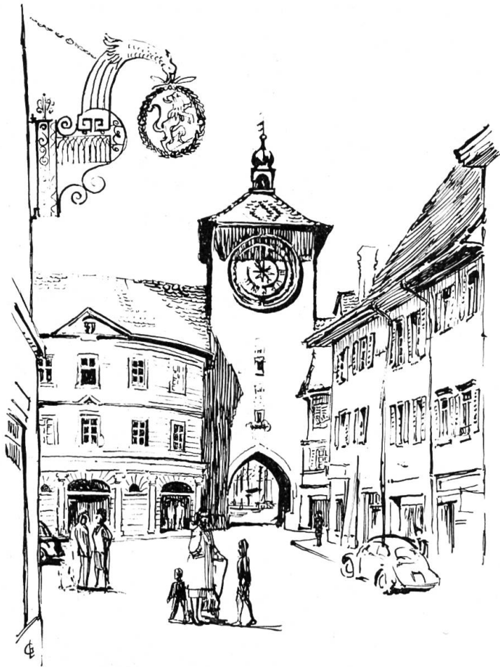
Delsberger- oder Obertor und Rathaus.