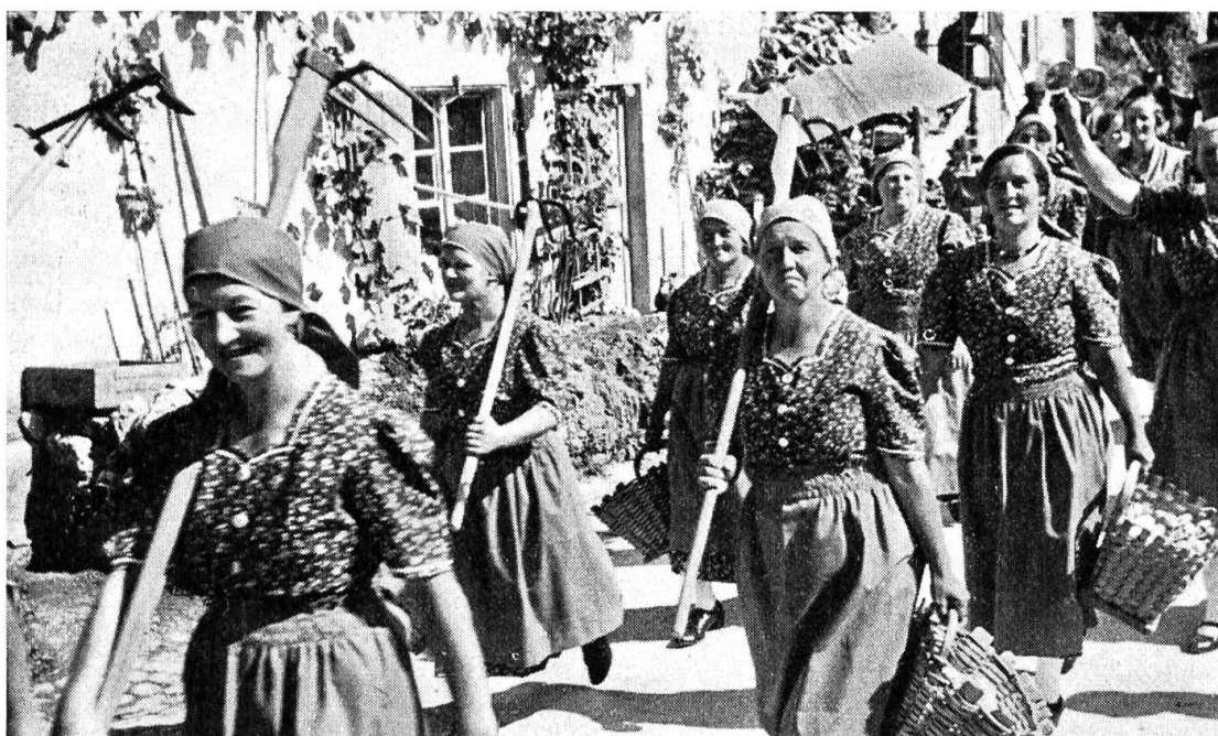
Trachtenumzug an der Schwarzbubentagung vom 11. September 1938 in Seewen