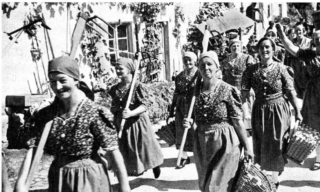
Trachtenumzug an der Schwarzbubentagung vom 11. September 1938 in Seewen