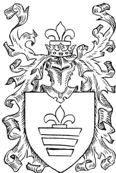
Kosciuszko-Wappen Feld rot, Balken und Lilien Silber, Krone und Kette Gold.