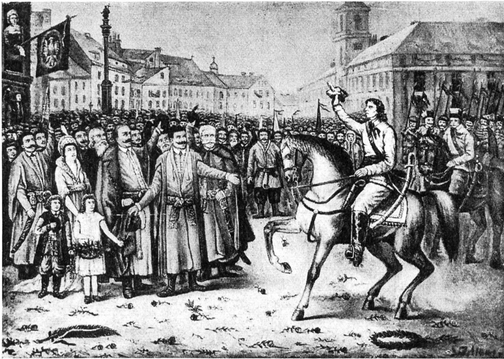
Einzug Kosciuszkos in Warschau am 10. Juli 1794. Stich von Molinari.

der Aufschrift «patriote, philosophe, ami» sowie die Abbildung der von ihm gedrechselten Schalen und Dosen.