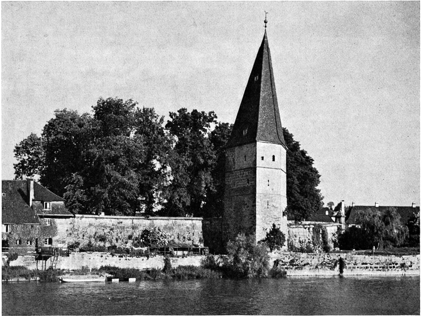
Die Krummturm-Schanze von der Aareseite.

zuschalten, schlug Grossen vor, den Schanzenring im Westen bis auf den Hermesbühl vorzuschieben, so dass das äussere Bieltor ungefähr in die Gegend der heutigen Zentralbibliothek zu stehen gekommen wäre. Der grosse freie Platz, der so innerhalb des Schanzenrings entstanden wäre, hätte nicht nur genügend Raum für freie Truppenbewegungen innerhalb der belagerten Stadt gelassen, sondern er hätte auch der Landbevölkerung der Umgebung Schutz geboten. So grosszügig Grossen auf dem linken Aareufer disponierte, so stiefmütterlich behandelte er allerdings die Vorstadt. Da ein Einbezug des Schöngrüns der ungeheuren Kosten wegen ausser Frage stand, begnügte er sich hier mit der Befestigung der kleinen Vorstadt allein, so dass der grössere Teil der Aarefront der linksufrigen Stadt ungedeckt geblieben wäre. Nur die weitgreifendste seiner verschiedenen Varianten erreicht durch drei den eigentlichen Bastionen vorgelegte Hornwerke einen etwas bessern Schutz des Stadtkerns.