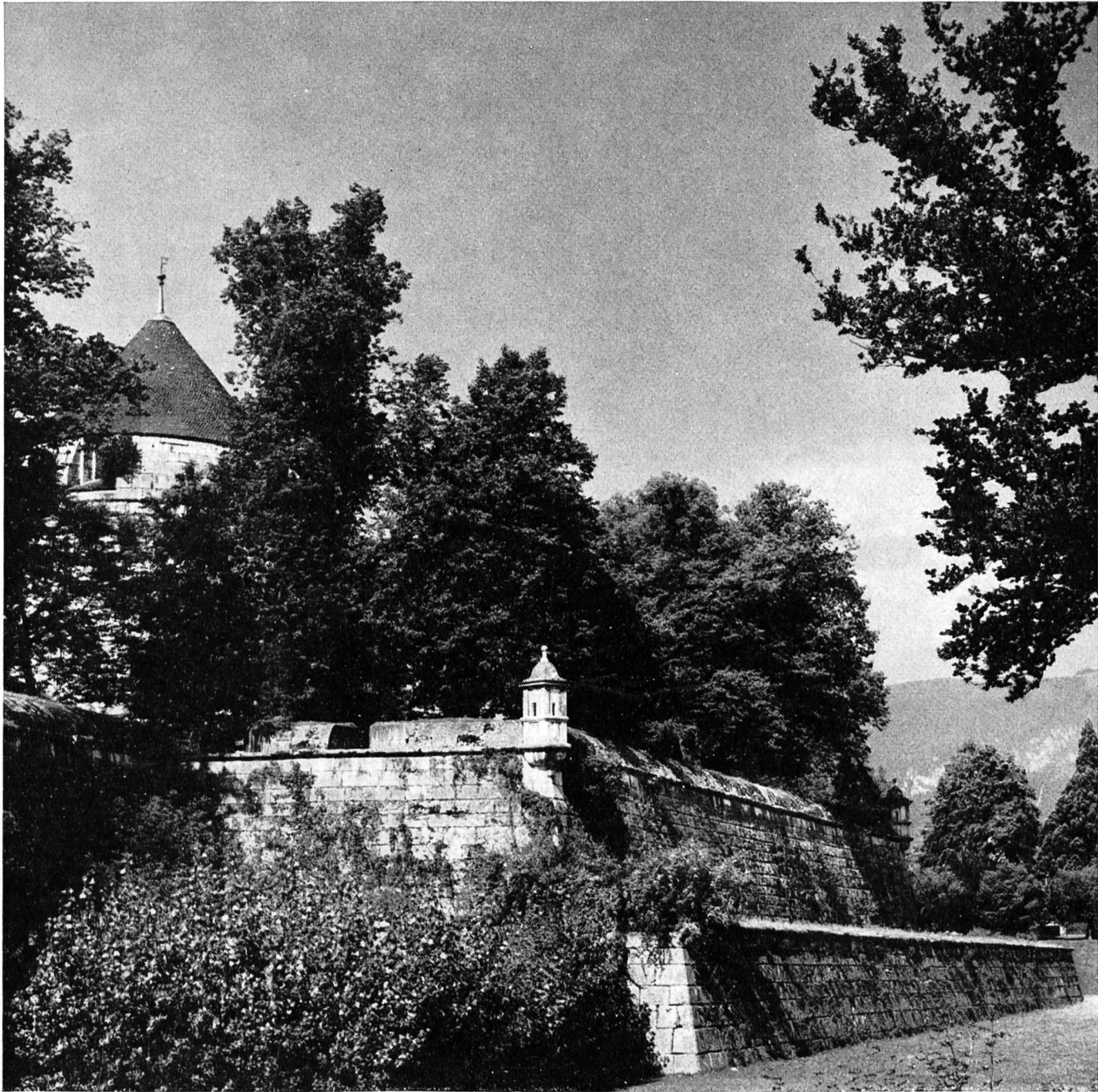
Die St. Ursenbastion (ursprünglich St. Victor)

nicht mehr die Rede war. Es kam dazu, dass auch die allgemeine politische Lage für die katholischen Orte höchst deprimierend war. Die Übermacht der grossen reformierten Städte hatte sich im vergangenen Kriege als so überwältigend erwiesen, dass an eine Revanche nicht mehr zu denken war, womit neue kriege-