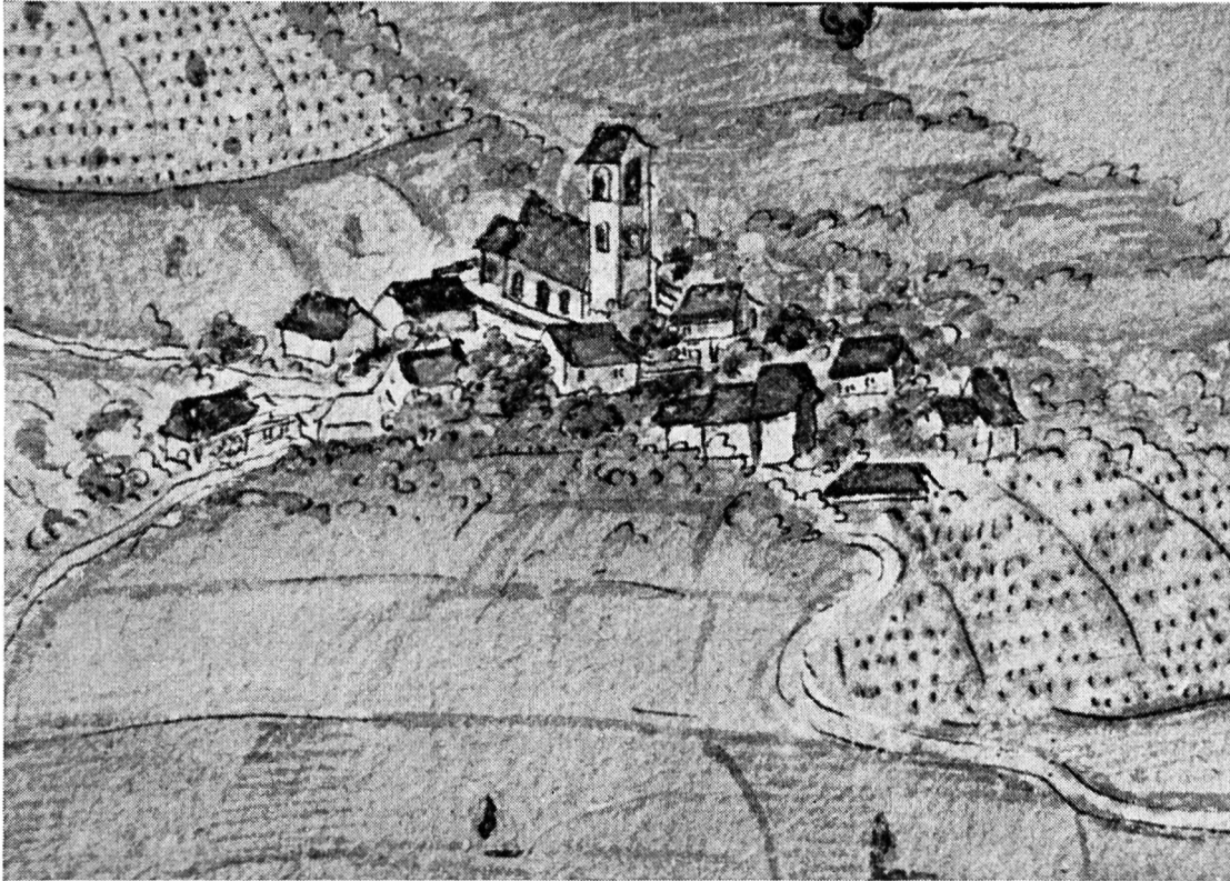
Dornach-Dorf, nach Jakob Meyer

Wir beschränken uns hier auf Dornach und Dornachbrugg.