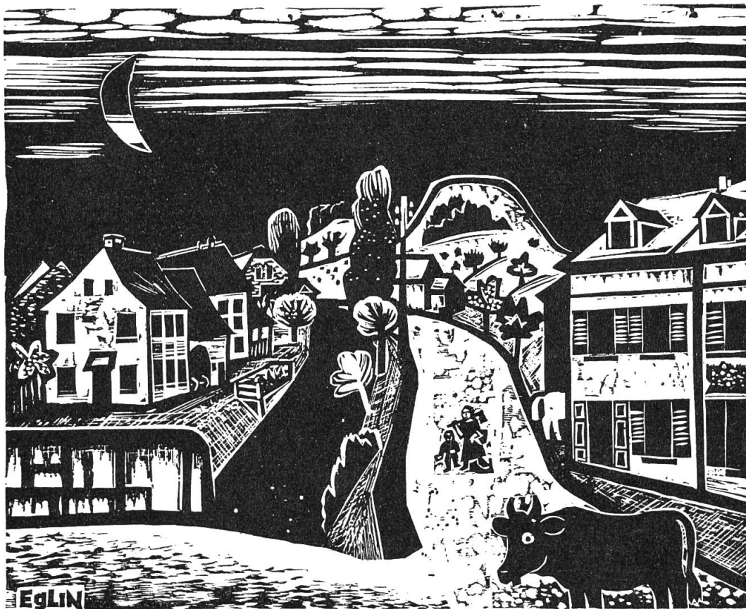
Der Zunzger Büchel. Holzschnitt W. Eglin (1895—1966).

alte Nordsüdverbindung führte bei Rheinfelden, das übrigens etliche Jahre vor Basel eine Rheinbrücke besass 6 , über den Rhein, dann an der Sissacher Flue mit ihrer Fluchtburg vorbei nach Sissach und darauf durchs Diegtertal über das Chall; von da aus konnte man gegen Osten über Ifental Olten erreichen oder südwärts gegen Hägendorf absteigen. Sissach lag demnach am Kreuzungspunkt zweier bekannter Verkehrswege, und so lässt sich auch seine Bedeutung als Hauptort des fränkischen Sisgaues erklären. Im Diegtertal ist der Zunzger «Büchel» besonders erwähnenswert; durch eine Grabung konnte nachgewiesen werden, dass hier eine frühmittelalterliche Holzburg gestanden haben muss 7 . In Diegten stand neben der Kirche ein Wohnturm, und auf den Anhöhen um Eptingen sind uns fünf mittelalterliche Burgstellen bekannt; sie waren wahrscheinlich alle im Besitz der Herren von Eptingen. Der Weg von Rheinfelden über Sissach und das Chall dürfte bis um 1200 seine Bedeutung gehabt haben. Damals war er die kürzeste Verbindung zwischen den Zähringischen Besitzungen in Süddeutschland und im Schweizer Mittelland. Mit dem Bau der Rheinbrücke in Basel und der Eröffnung des Weges durch die Schöllenen zum Gott-hard geriet er in Vergessenheit.