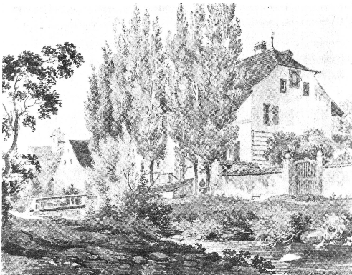
Pfarrhaus und Kirche von Diegten. Kolorierte Zeichnung von F. Reinermann aus dem Jahre 1800. Kantonsmuseum Liestal.