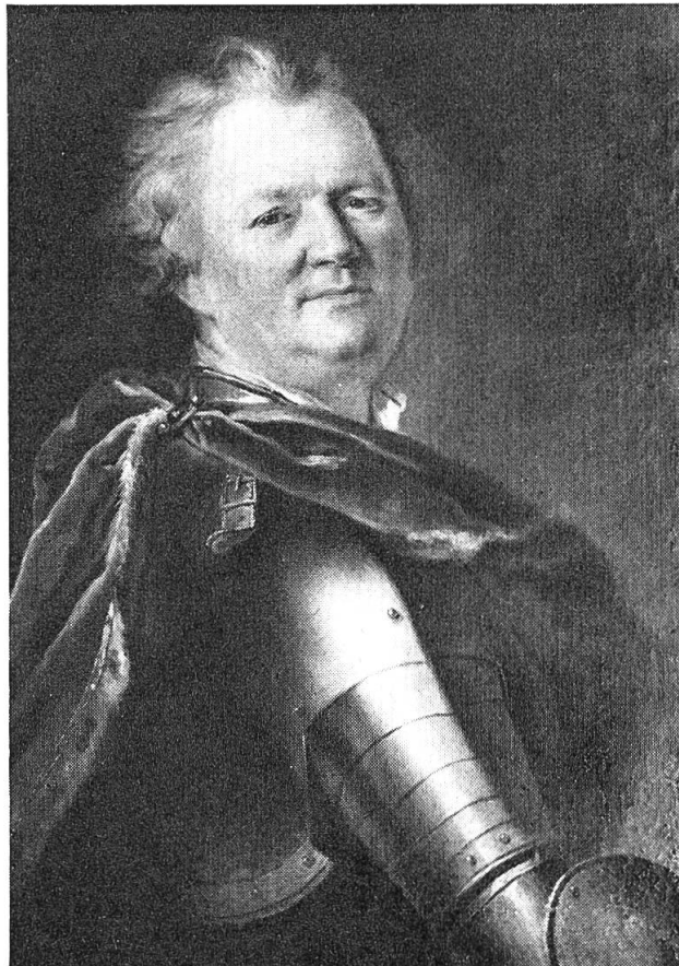
Johann Viktor Besenval (1671—1736), französischer Gesandter in Schweden und Polen. Original Schloss Waldegg.

Frankreich wurde Johann Viktor Besenval im Jahre 1722 Generalleutnant und Oberst des Schweizergarde-Regiments. Sein Grab befand sich in der Kirche St. Sulpice in Paris, wurde aber in der Revolution zerstört.