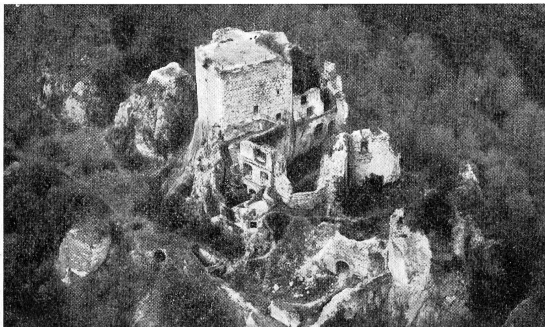
Flugaufnahme der Ruine Landskron

keine Gefolgschafts- oder Vasallenvereinigung dar; sie standen ausserhalb der Lehnordnung und damit auch ausserhalb des Staates. Die beiden Gesellschaften können deshalb als frühe Belege von ausserstaatlichen, privaten Kriegerverbänden angesehen werden. Die Frage, ob sie in die Nähe der Bundschuhvereinigungen gehören, muss hier offengelassen werden. Gewisse Ähnlichkeiten und Übereinstimmungen mit Bundschuhveranstaltungen von Adligen aus der Basler Gegend im 15. Jahrhundert ist jedenfalls nicht zu übersehen. 25