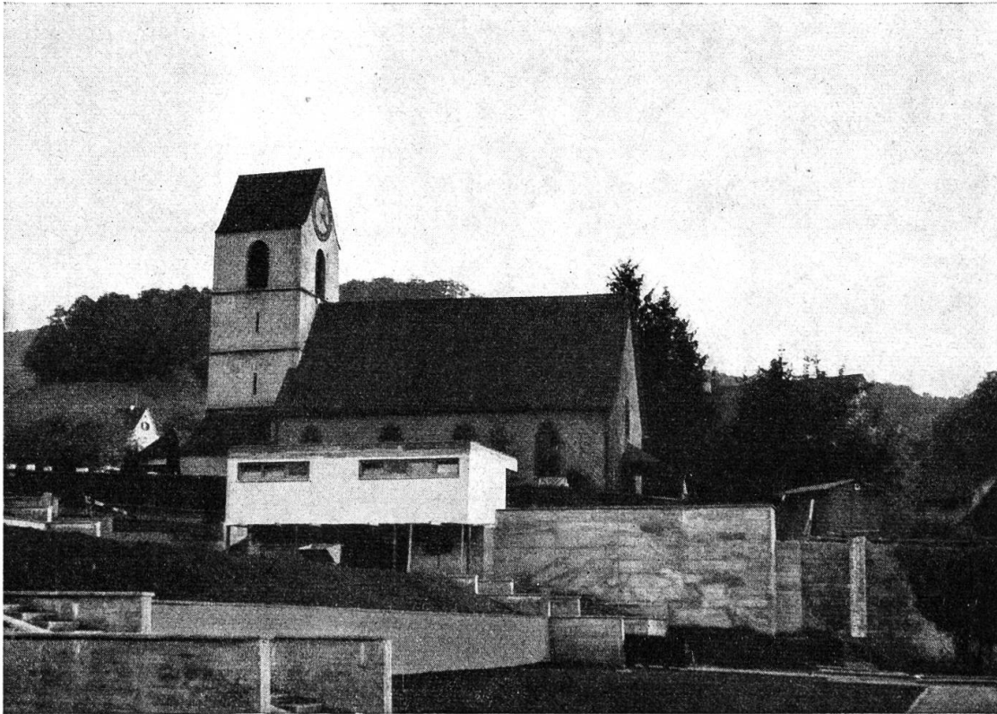
Ansicht der Kirche von Münchenstein von Norden