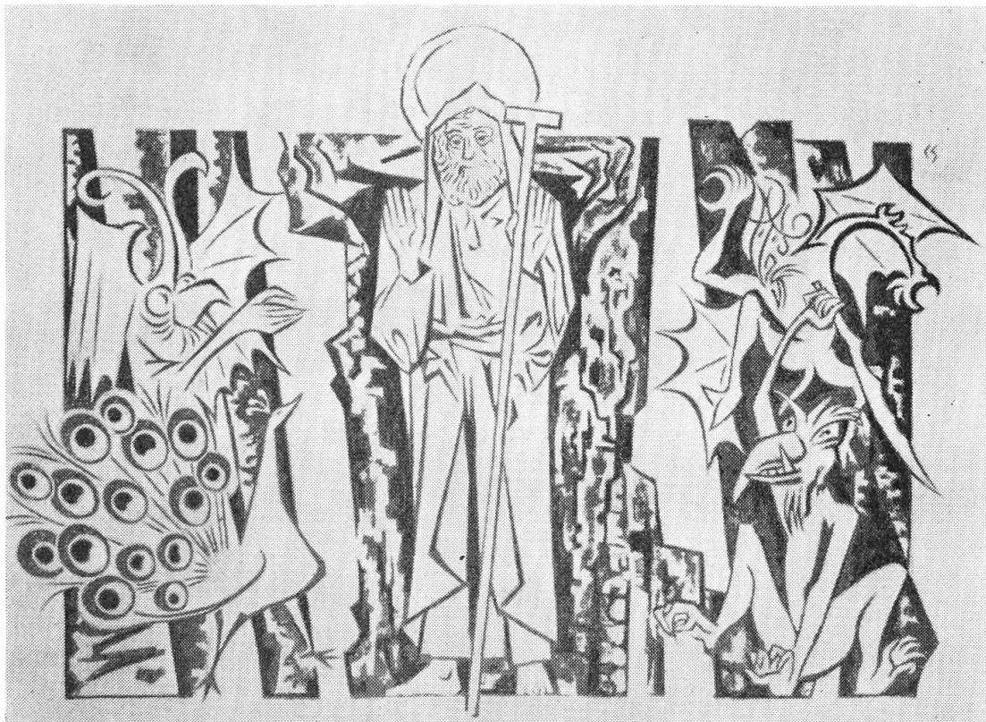
Das neue, dreifarbiges Sgraffito an der Nordwand der Kapelle. Es stammt von C. Spiegel und stellt die Versuchung des hl. Antonius dar.

dene Malerei wieder eine Nachfolgerin gefunden. Spiegel verstand es, dem Heiligen Würde und Größe zu geben, andererseits die Teufel so zu gestalten, daß sie nicht trivial wirken oder den Wallfahrer irritieren. Die Versuchung des hl. Antonius ist nicht nur seit je ein beliebtes Thema der Malerei gewesen, sie ist auch für den Christen eine wirklichkeitsnahe Idee.