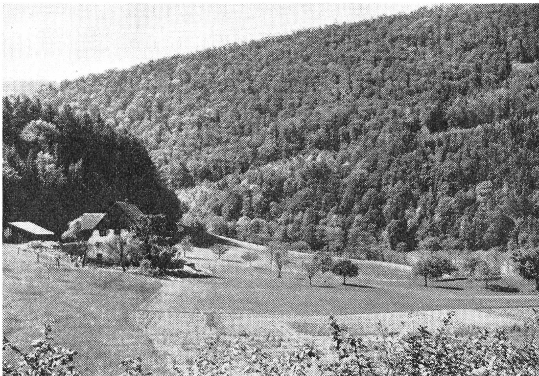
RICHENWIL, nördlich Hägendorf. Ein einsames Juratälchen, das der besonderen Aufmerksamkeit des Heimatschutzes würdig ist. Am Waldrand in der rechten Bildhälfte wird sich das S-Portal des Belchentunnels öffnen, von wo die Autobahn mitten durch die Wiesenmulde hindurch sich in den Vordergrund des Bildes ziehen wird.