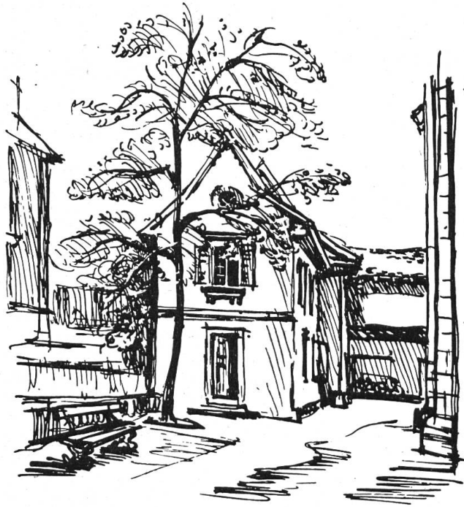
Das Häuschen zwischen Martinskirche und Martins- gäßchen in Basel.

hatte und zum großen Schaden der Seelsorge oft weit von der Kirche entfernt gewohnt hatte. Von den Leutpriestern, die hier Wohnsitz hatten, ist Johannes Huschin (= Häuschen oder Hausschein), genannt Ökolampad, der prominenteste. Er wohnte hier bis 1529, als er bei der Einführung der Reformation Oberstpfarrer am Münster wurde.