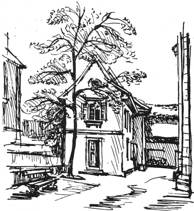
Das Häuschen zwischen Martinskirche und Martins- gäßchen in Basel.

hatte und zum großen Schaden der Seelsorge oft weit von der Kirche entfernt gewohnt hatte. Von den Leutpriestern, die hier Wohnsitz hatten, ist Johannes Huschin (= Häuschen oder Hausschein), genannt Okolampad, der prominenteste. Er wohnte hier bis 1529, als er bei der Einführung der Reformation Oberstpfarrer am Münster wurde.