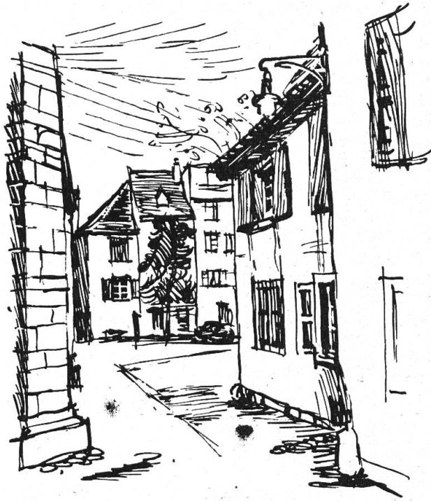
Blick von der Südostecke der Martinskirche zu Pfarr- und Sigristenhaus am Martinskirchplatz in Basel.

Teufelsgäßchen vor. Am Martinskirchplatz schließen das gotische Haus des Siegristen und das Eckhaus am Teufelsgäßlein an, während am Rheinsprung das unter Denkmalschutz stehende, prächtige Fachwerkhaus* «zum Brauer» (Nr. 14) angefügt ist. Somit bleibt dem Pfarrhaus gegen den Martinskirchplatz und gegen das Teufelsgäßlein nur noch Platz für zwei schmale spätgotische Fassaden.