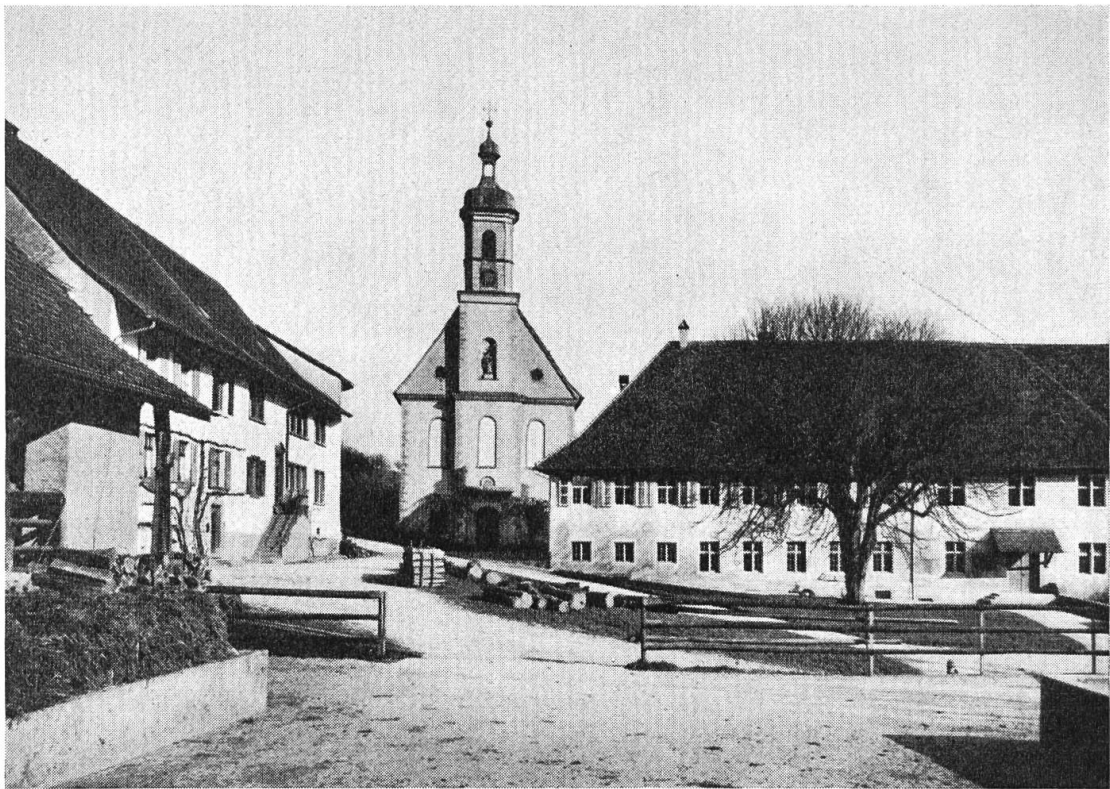
Kloster Olsberg: Die Klosterkirche zwischen Ökonomie- und Konventgebäuden, Ansicht von Westen.