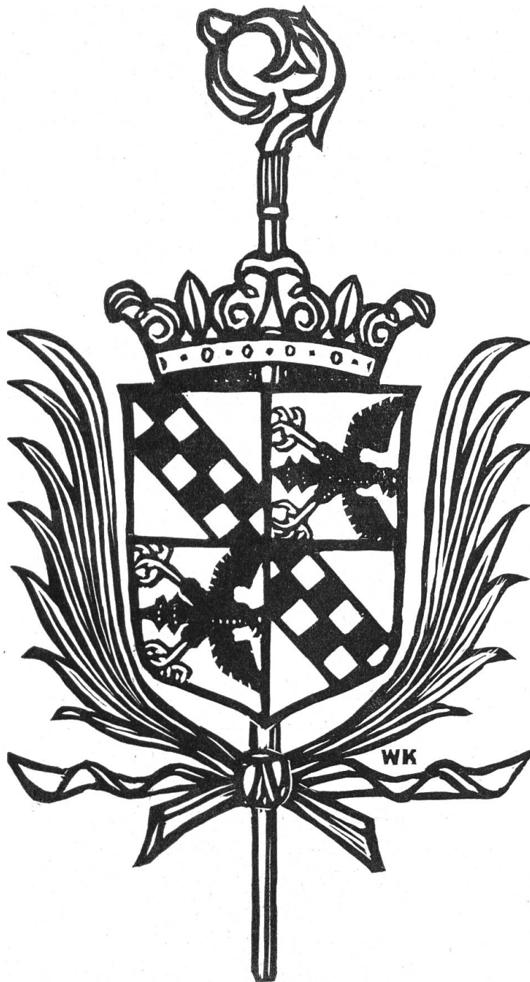
Kloster Olsberg: Wappen der Äbtissin Franziska von Eptingen (1634—1707), an der Decke des Refektoriums, aus dem Jahre 1684.