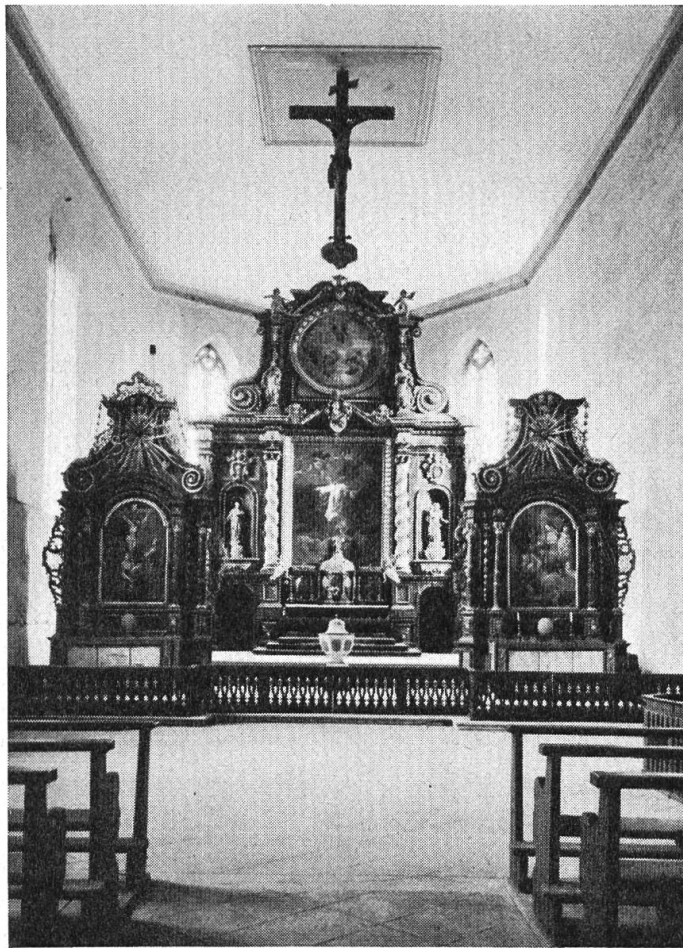
Kloster Olsberg: Blick in den Chor der Kirche mit den hochbarocken Altären.

vor dem hohen Adler einnehmend, auch eine hübsche Schau dörflichen Charakters von Füllinsdorf bietend, liegt von Olsberg noch mehrere Kilometer weiter entfernt und kann nur durch die Überwindung des breiten Ergolztales gewonnen werden. Und das ist die wirtschaftliche Tatsache: Mechtildis, die Gattin des Junkers Heinrich von Waldenburg, verkauft 1302, Apr. 17., dem Kloster Olsberg eine Schuppose in Frenkendorf um 10 Pfund Pfennige mit dem Recht des Rückkaufs als Vorbehalt.