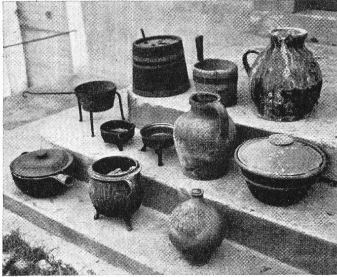
Alte Bauernhäuser und Landsitze sind gelegentlich noch heute angefüllt vom Keller . . .

noch mehr aber rasch entschlossene Praktiker und Schlauberger, welche es verstanden, sich diese achtlos beiseite geschafften Antiquitäten anzueignen und sie um teures Geld an Liebhaber zu verkaufen. Was man damals von solchen — jetzt hoch geschätzten und entsprechend bezahlten — Gegenständen hielt, mag ein Beispiel aus einem Baselbieter Dorfe zeigen. Ein Altertumsfreund bot den Mannen vom «Glöggeli-Wagen» für jeden kupfernen Gegenstand, den sie für die Abfallgrube mitführten, einen Fünfliber an. Er wurde im ganzen Dorf verlacht, und man zweifelte an seinem gesunden Verstand, weil er das Geld so verschwende. Er aber sammelte liebevoll alle die herrlichen Kupfergefäße von der einfachen Schöpfkelle bis zum großen «Gepsi». Heute zahlt man für die größeren Stücke Preise von hundert Franken an aufwärts.