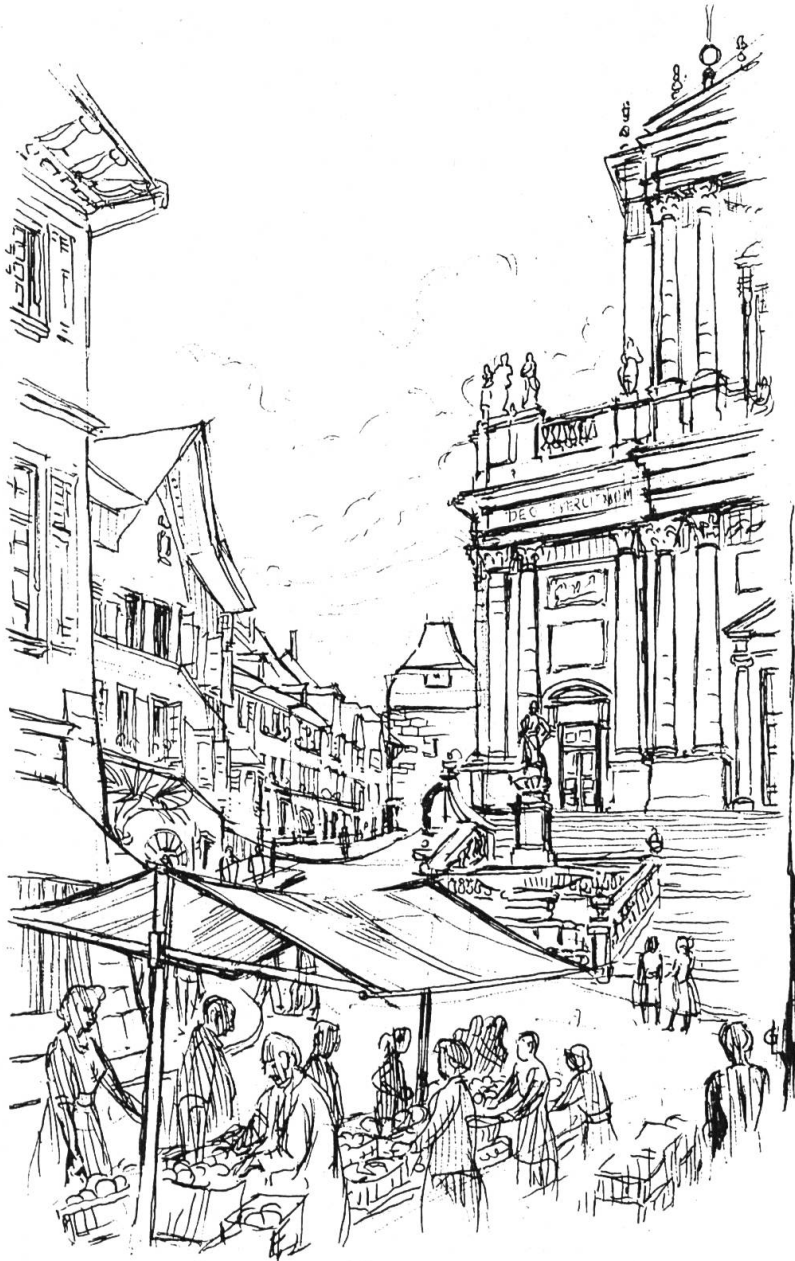
Markt in Solothurn

der breiten Behaglichkeit der Allee sammelt sich das Volk in der Feierstunde, setzt sich auf die Bänke und gibt sich der geruhsamen Beschaulichkeit hin.