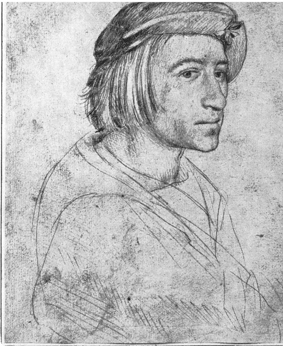
Ambrosius Holbein (um 1490—1519?): Brustbild eines jungen Mannes mit halblangem Haar und Barett, 18/24 cm Silberstift. Basel, Kupferstich- kabinett