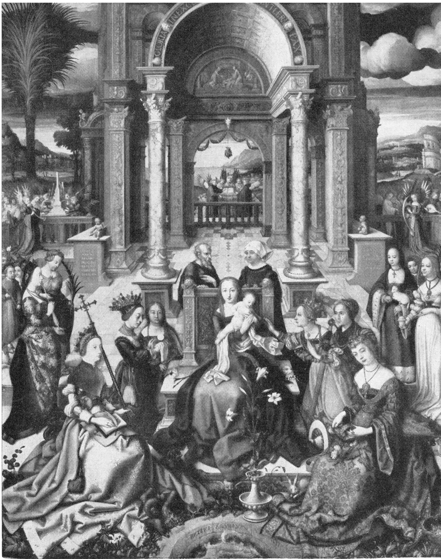
Hans Holbein d. Ä. (nach 1460 — vor 1524) : Der Lebensbrunnen, 193/137 cm Tempera auf Holz. 1519. Lissabon, Museu Nacional de Arte Antiga