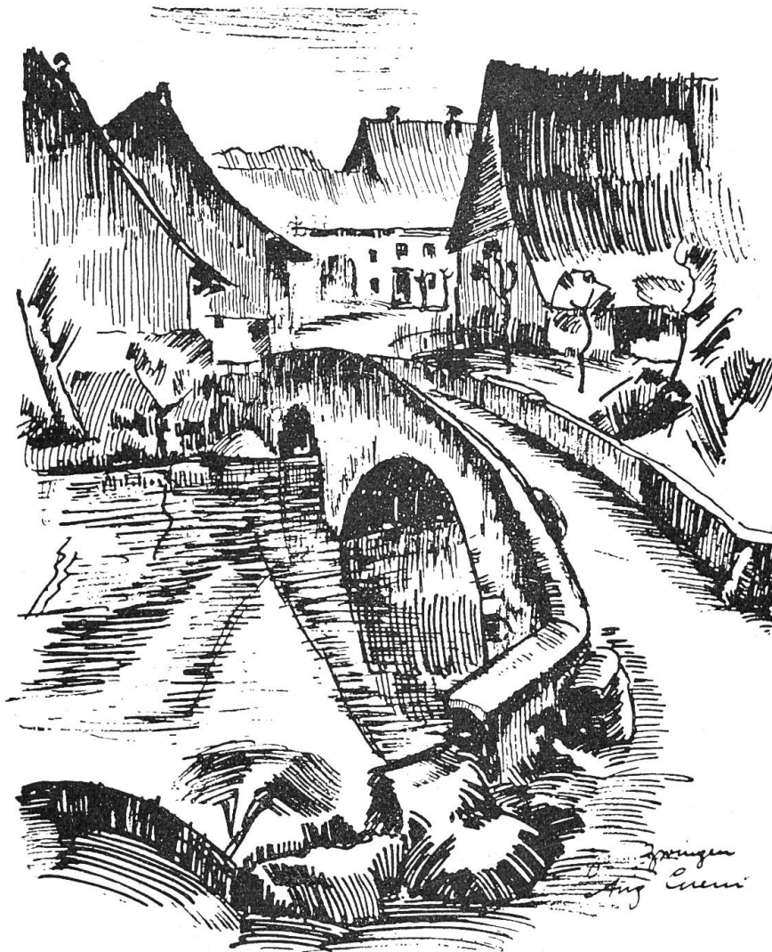
Zwingen. Die alte Birsbrücke, die nächstens durch einen Betonbogen ersetzt und abgebrochen werden soll