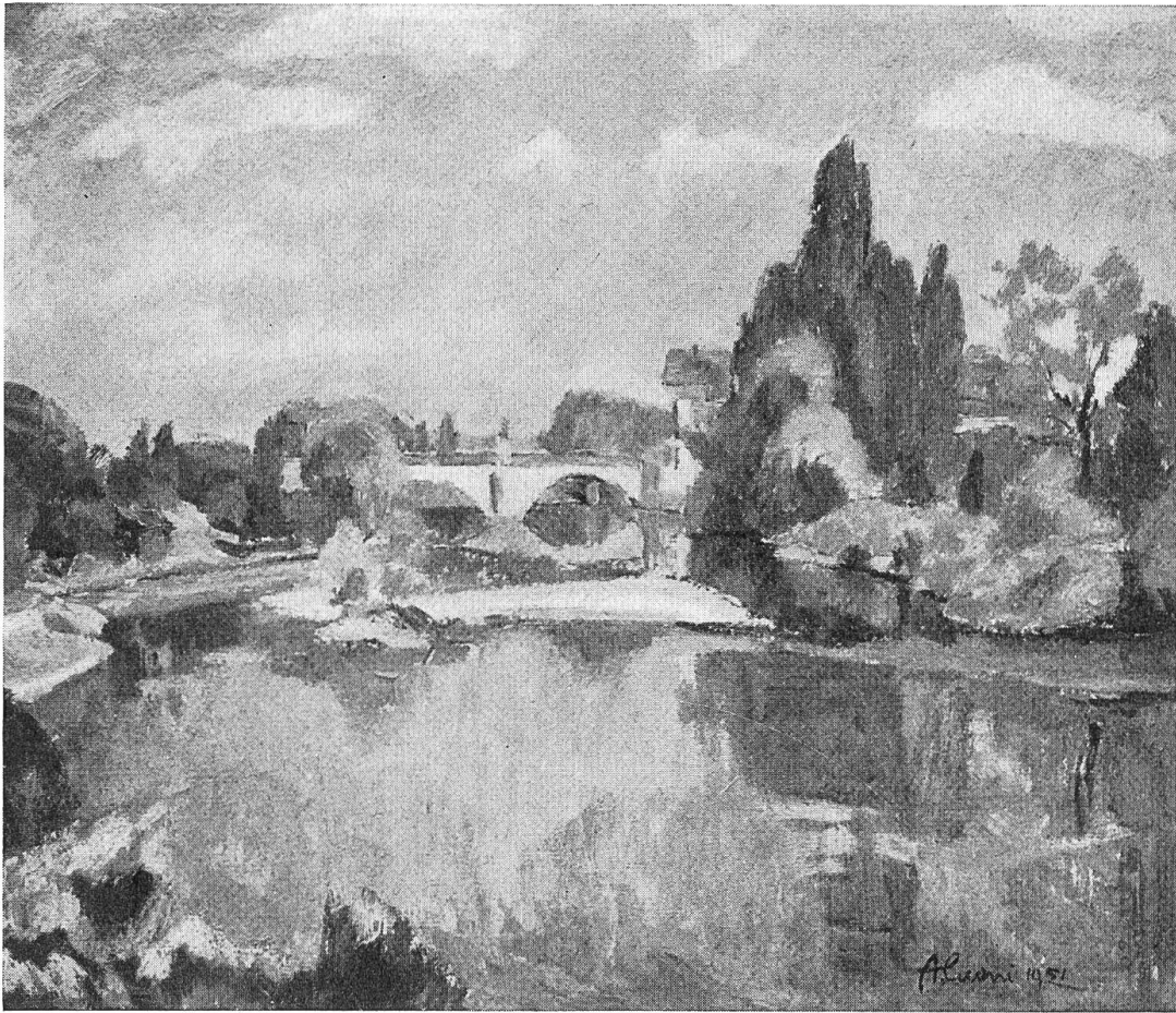
Birs bei Dornach, von A. Cueni