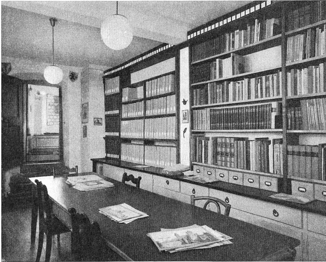
Blick vom Archivraum zur Modellstube im Schweiz. Burgenarchiv, Stapfelberg 4, Basel