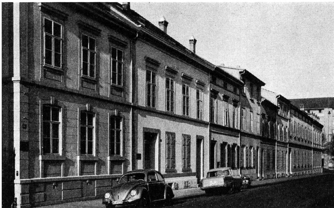
Holbeinstrasse 14—2, Basel