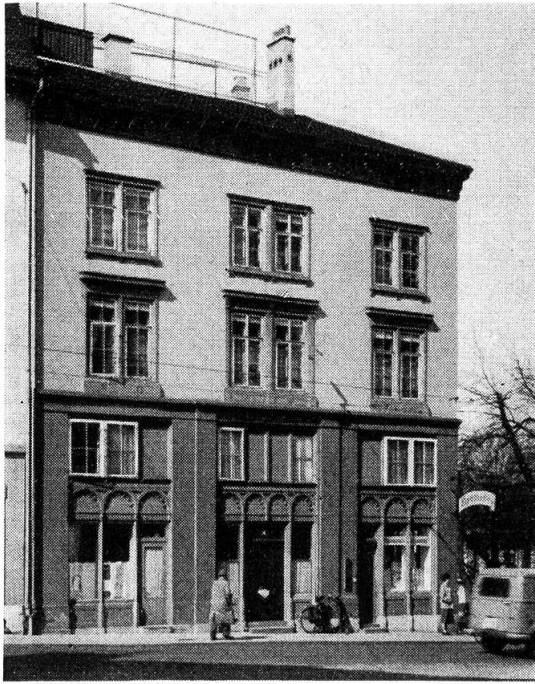
Eckhaus Elisabethenstrasse 18 / Klosterberg, Basel, von J. J. Heimlicher?