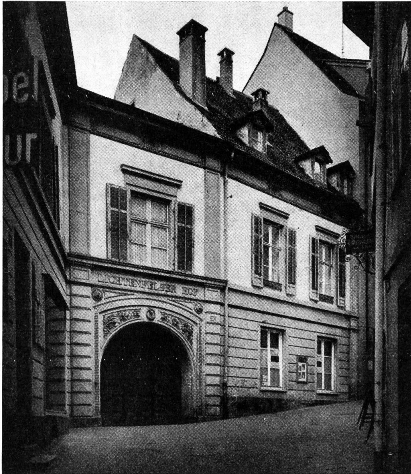
Der Lichtenfelser Hof, Münsterberg 9, Basel

stukaturen» ehrenvollere Argumente zur Erhaltung eines Baues, als sein Stil — aber an dergleichen Beispielen ist wohl wenig mehr vorhanden. (Der «Lichtenfelserhof» hat einige Meriten dieser Art, obwohl natürlich weit näher gegen die Jahrhundertmitte erbaut).