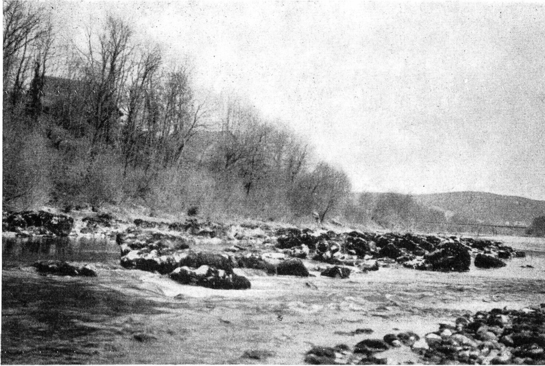
Sog. Hungersteine am Aareufer beim Mühledorf (Niedergösgen) — sichtbar bei Niederwasser, Vorboten einer Teuerung