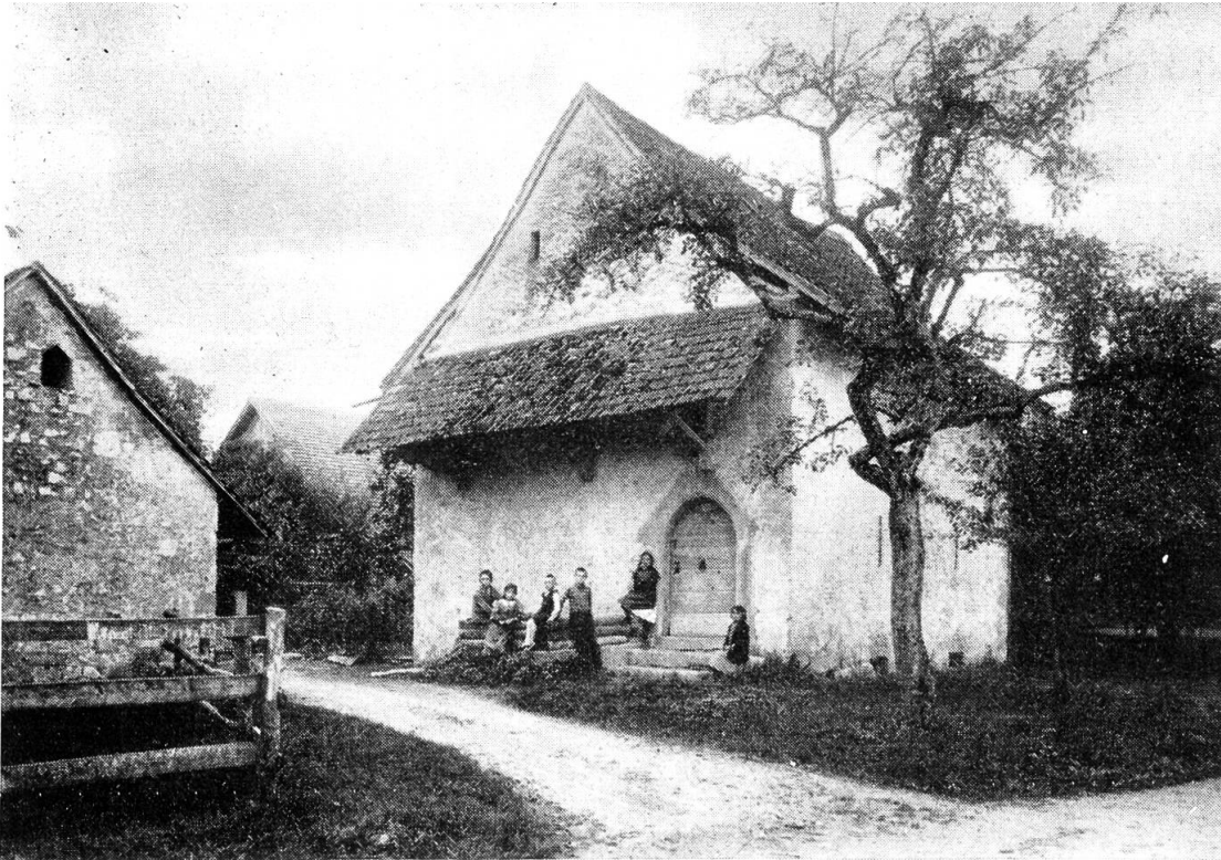
Einer der seltenen gemauerten Speicher im Kanton, der alte Zehntstock von Däniken Alte Aufnahme (1587)

Aber auch den Frobürgern war es nicht beschieden, ein geschlossenes und straff regiertes Fürstentum zu errichten, ihre Lehensträger (Bechburger, Falkensteiner) und Ministerialen (z. B. die Herren von Olten, Ifenthal, Hagberg, Winznau, Wangen, Trimbach, Adlikon bei Wisen) durch Beamte zu ersetzen und damit die partikularistischen Kräfte zu überwinden. Wie für die großen war auch für diese kleinen Herren die Zeit vorbei. Die Zukunft gehörte diesseits des Rheins einem neuen Stand, dem städtischen Bürgertum.