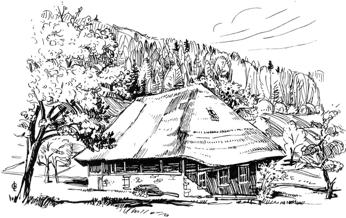
Das letzte vollständig erhaltene Strohhaus im Kanton steht in Rohr unterhalb der Schafmatt Zeichnung von G. Loertscher

Gösgen regiert, bis es im Jahre 1623 zum Schultheißenamt Olten geschlagen wurde; daher auch die heutige Zugehörigkeit zum Bezirk Olten.