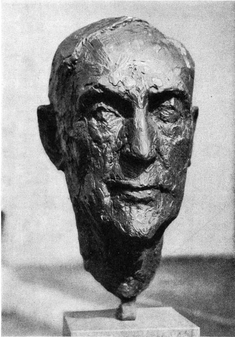
Cuno Amiet. Porträtplastik (Bronze) von Oscar Wiggli, Solothurn/Paris, 1956