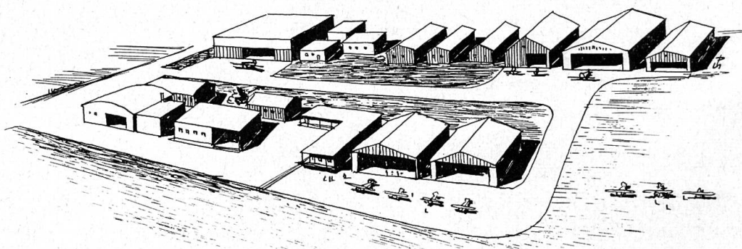
Die Bauten des Flugplatzes